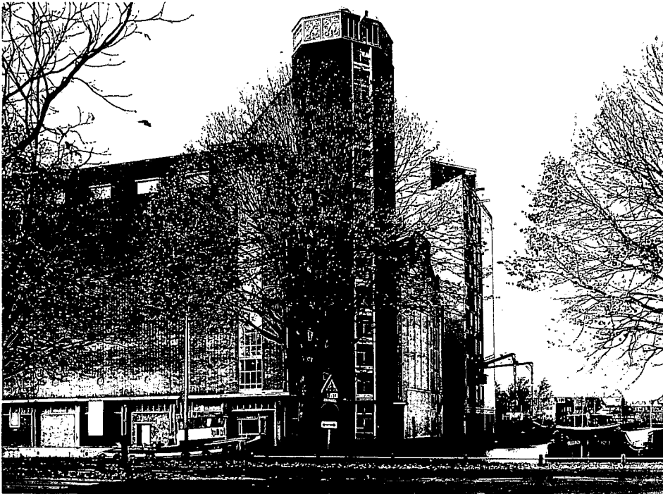
De Meelfabriek aan de Zijlsingelzijde. (foto's N.J. Bavelaar).

Een hoge betonnen kolos aan de Zijlsingel torent hoog boven de Leidse binnenstad uit. Voor veel Leidenaars een monsterlijk bouwwerk, voor anderen een monument. Na een jarenlange discussie maakt deze voormalige Leidse Meelfabriek De Sleutels nu een goede kans om een plaats te krijgen op de Rijksmonumentenlijst.