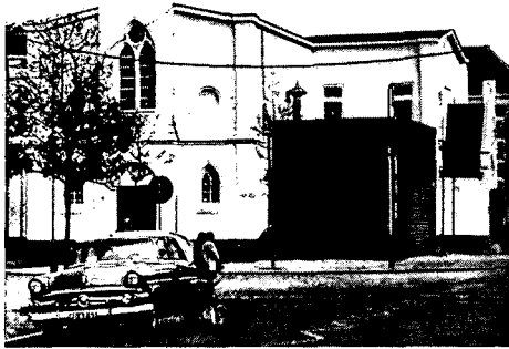
De Irene-studio in Bussum