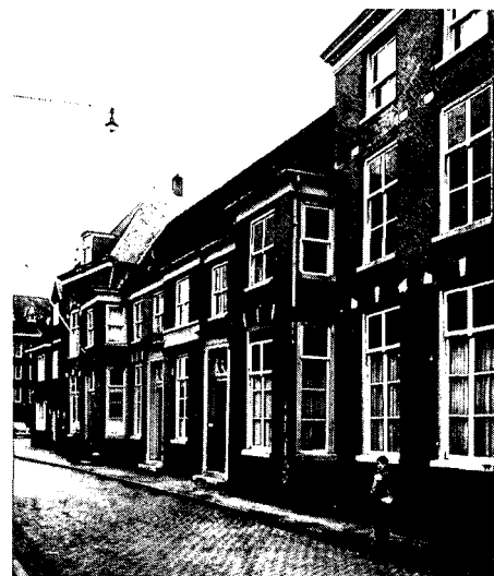
Voorgevel aan de Keizerstraat. De gevel kreeg dit uiterlijk na de verbouwing tot weeshuis in 1783 en de wijzigingen in 1855 ev. Er zijn twee ingangdeuren vanwege de strikte scheiding destijds tussen jongens- en meisjesafdeling.

Als laatste voorbeeld van het benutten van gegevens uit het vooronderzoek kan genoemd worden de hoofdtoegang. In de voorvleugel zijn aan binnenplaatszijde twee van de drie hardstenen bogen zichtbaar, die voor een deel bestaan uit hergebruikte laatgotische natuursteenelemen-