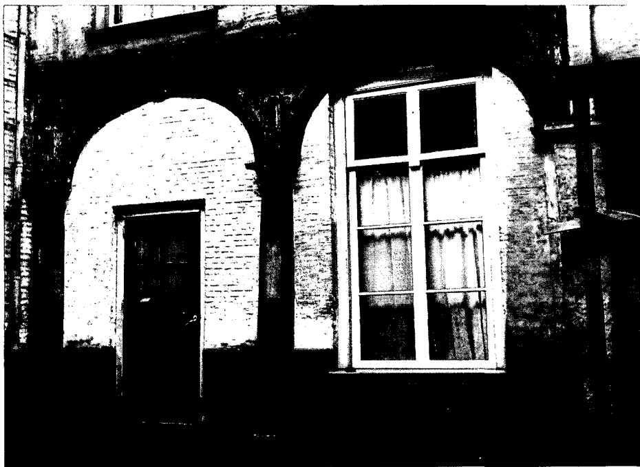
Boogstelling op de binnenplaats.