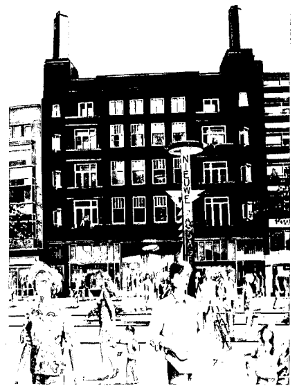
De bestaande entree van de passage na vernieuwing.

ling van een middeleeuwse stadspoort. Zo heel verbazingwekkend is dat niet: de Broersvest was de buiten-achtergracht van de hoefijzervormige stad. Tevens was deze gracht boezemwater, met de Schie zelf, van het poldertje Riviere dat heden ten dage nog terug is te vinden in de stadsplattegrond. Op de dijk stond tevens ongetwijfeld een palissade of muur. Meer naar binnen en lager lag het zogeheten Broersveld. Nu een straat, vroeger een binnenwaterloop. De Passage is op dit moment in renovatie, men kan er niet doorlopen, de winkels aan de binnenstraat staan leeg. De bioscoop is gesloopt. In de redengevende omschrijving van de gemeentelijke monumentenlijst wordt het gebouw omschreven als zijnde gebouwd in Art Deco-stijl, met nog goeddeels gave detaillering. Het complex is tevens een hoogtepunt in het oeuvre van de architect van wie veel gebouwen in Schiedam staan. Wie Hilversum zegt, zegt Dudok . Wie Schiedam zegt, zegt Sanders . Verwacht mag worden dat wanneer de bioscoop vervangen zal zijn door een passend