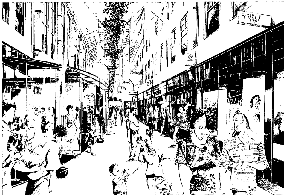
Impressie vernieuwde passage.

een gevoel van teleurstelling nauwelijks onderdrukken toen hij de maquette-foto's, hem toegezonden door MAB, onder ogen kreeg. Aan de