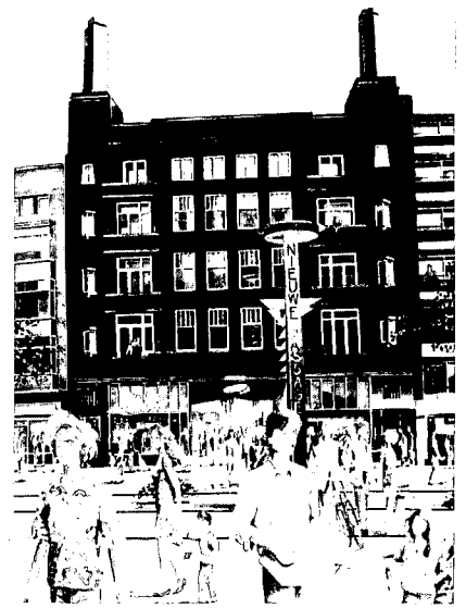
De bestaande entree van de passage na vernieuwing.

ling van een middeleeuwse stadspoort. Zo heel verbazingwekkend is dat niet: de Broersvest was de buiten-achtergracht van de hoefijzervormige stad. Tevens was deze gracht boezemwater, met de Schie zelf, van het poldertje Riviere dat heden ten dage nog terug is te vinden in de stadsplattegrond. Op de dijk stond tevens ongetwijfeld een palissade of muur. Meer naar binnen en lager lag het zogeheten Broersveld. Nu een straat, vroeger een binnenwaterloop. De Passage is op dit moment in renovatie, men kan er niet doorlopen, de winkels aan de binnenstraat staan leeg. De bioscoop is gesloopt. In de redengevende omschrijving van de gemeentelijke monumentenlijst wordt het gebouw omschreven als zijnde gebouwd in Art Deco-stijl, met nog goeddeels gave detaillering. Het complex is tevens een hoogtepunt in het oeuvre van de architect van wie veel gebouwen in Schiedam staan. Wie Hilversum zegt, zegt Dudok . Wie Schiedam zegt, zegt Sanders . Verwacht mag worden dat wanneer de bioscoop vervangen zal zijn door een passend