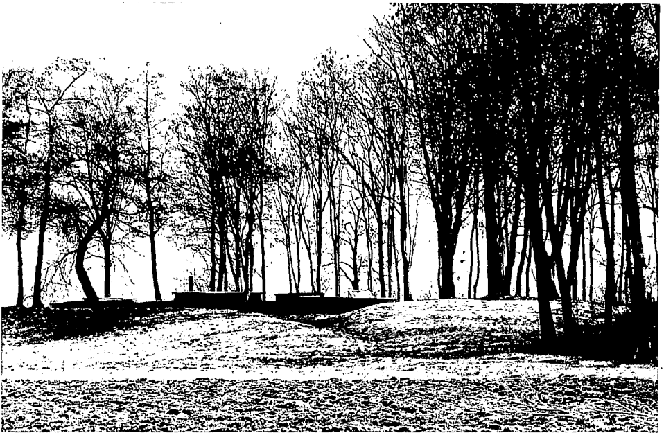
De resten van het middeleeuwse kerkje van Ens op de Zuidpunt van Schokland

Emmeloord. Ondanks het steeds maar weer verbeteren van de dijken, met alle beschikbare middelen, turf, klei, zeewier, stenen, houten palen en zelfs koemest (de zogenaamde Schokken), halveerde de oppervlakte van Schokland tussen 1600 en 1800. In de 18de eeuw werd serieus overwogen om een deel van het eiland aan de zee prijs te geven. De strategische ligging aan de scheepvaartroute van de IJssel naar Holland- sinds 1628 had Schokland een vuurbaak- voorkwam dit. De Schokkers bleven op hun eiland-wonen. Maar iedere storm betekende een aanslag op de dijken rond het eiland.