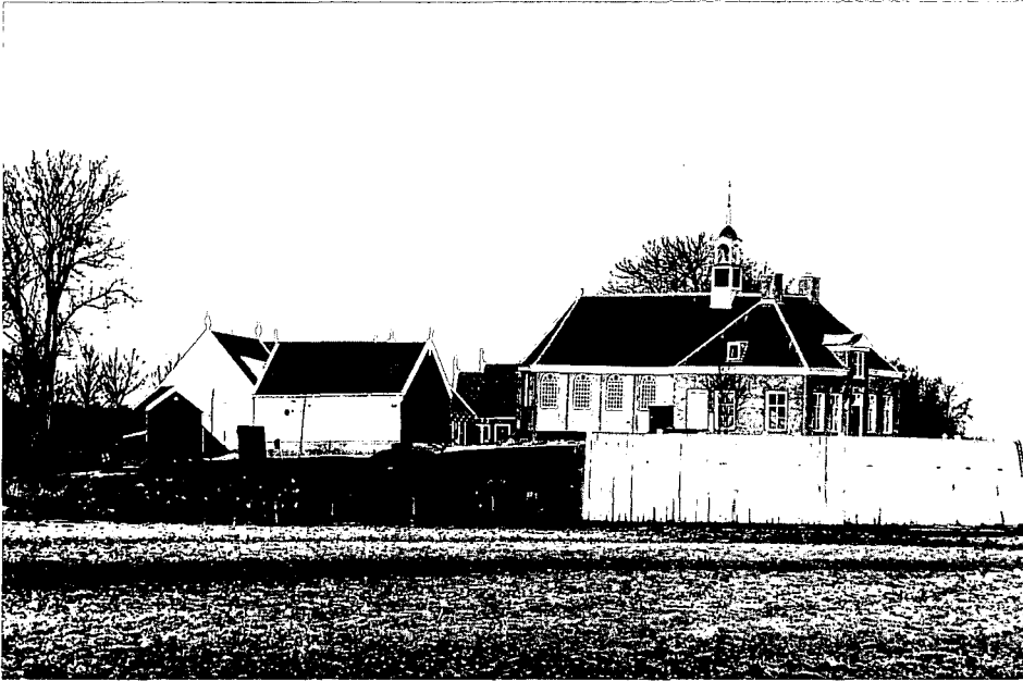
De terp van Middelbuurt: Museum Schokland

In volgende afleveringen van Heemschut aandacht voor andere kandidaten voor de Wereld Monumentenlijst.