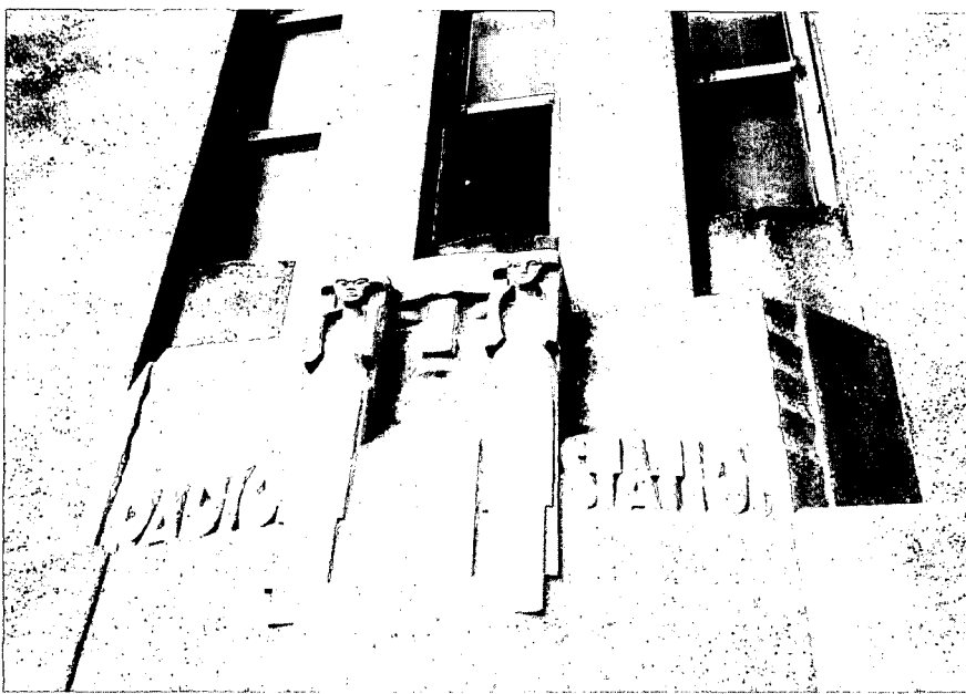
Versiering boven entree in stijl Amsterdamse School.

eerder was zonder veel vertoon het radiostation Malabar in de buurt van Bandoeng in gebruik genomen. Vier jaar later kwam de radiotelefonie: in 1927 werden de eerste proefgesprekken met Bandung over en weer gevoerd, een jaar later kwam het radiotelefonisch verkeer met Nederlands-Indië tot stand.