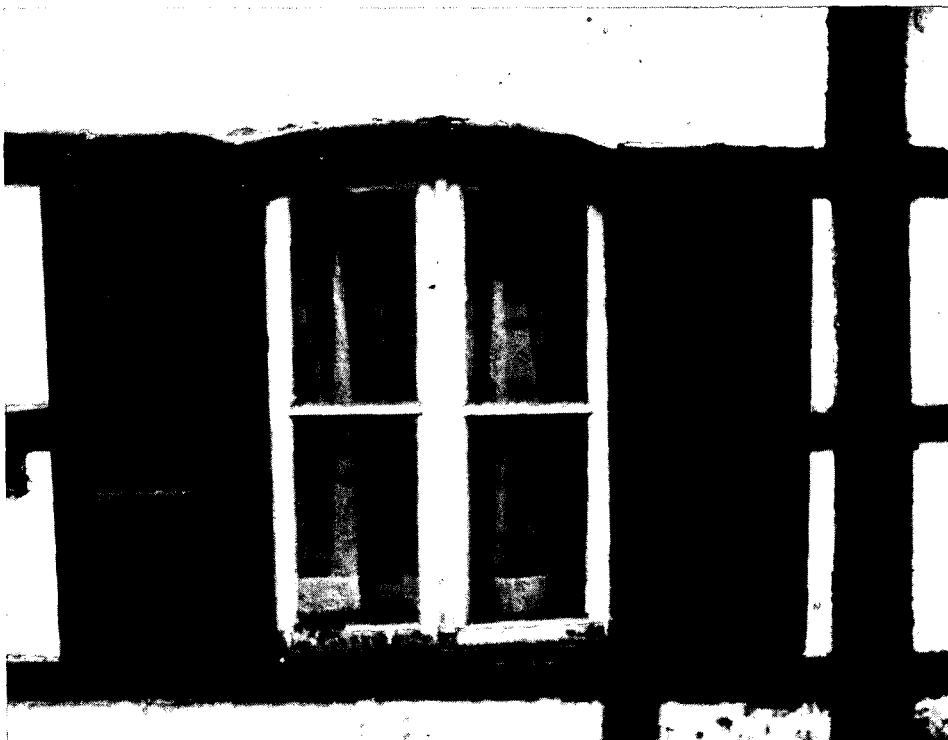
Raam met gebogen bovendorpel, uitgezaagd in de regel. Plaats: Terstraten. Jaar: plm. 1750.

We zullen het dan verder niet hebben over het verschil in raambehandeling en -detailering, die in tijd en soort in het zuid-oosten