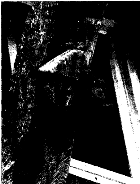
Schoorbalken dakoversteken in Sijpelteld. Jaar: 1659.

In meer materiële zin zien we dit verschijnsel bij het gebruik van telmerken, de ingehakte, ingekraste, getrokken, geslagen of geschreven merktekens van de timmerman, nodig om het bouwpakket op de bouwplaats in de juiste volgorde te monteren. Bij de telmerken komen we namelijk systemen tegen, die afwijken van de varianten op het