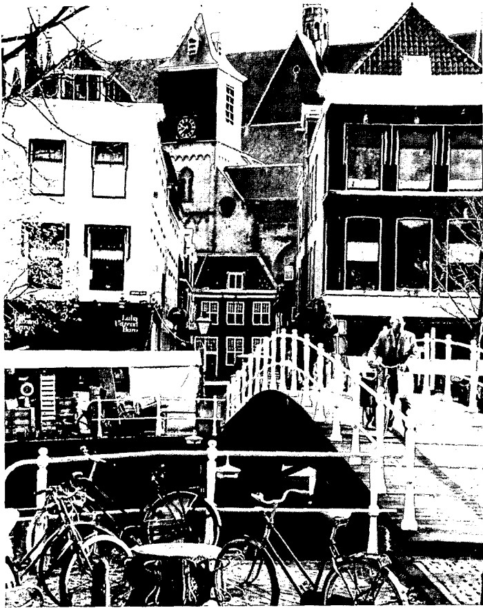
Het beschermd stadsgezicht beoogt niet de bestaande toestand te bevriezen. De Sint Sebastiaansbrug is aan de bestaande situatie toegevoegd vooral ten behoeve van het winkelend publiek en om meer samenhang te krijgen tussen de winkelgebieden van de Breestraat en de Haarlemmerstraat.

zich kunnen voordoen. Op elke kaart is de bestaande situatie aangegeven. Door de ontwikkelingsmogelijkheden ten opzichte hiervan aan te geven, kan men uit de kaarten aflezen, waar bepaalde ontwikkelingen gestopt of zelfs teruggedraaid dienen te worden. Zo is op de ruimteaspectkaart aangegeven, hoe de bestaande bebouwing en de aanwezige openbare ruimten gewaardeerd zijn. Daarbij heeft de nota Te Beschermen Stadsgezicht Leiden een belangrijke rol gespeeld. Maar men is bij het maken van die kaart verder gegaan. Ook de bebouwing van ná 1850 tot 1978 is daarbij in ogenschouw genomen. Hoe hoger die waardering uitvalt, des te moeilijker zal het zijn daar verandering in aan te brengen, zo is de strekking van het structuurplan. In dat plan is ook veel uitgebreider dan in de nota Te Beschermen Stadsgezicht onderzocht, wat die te beschermen Leidse karakteristiek inhoudt. Een paar uitkomsten van dit onderzoek: