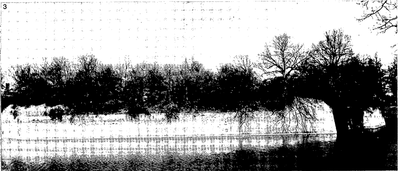
1 Plattegrond van Bergen op Zoom anno 1748 naar een door Franse ingenieurs vervaardigde kaart. De pijl wijst naar het Ravelijn op den Zoom

Door het naar elders overbrengen van de kwekerijkassen c.a. heeft men nu de kans