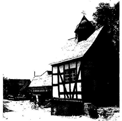
De kerk te Niedereisenhausen, vóór restauratie, overgenomen door de 'Förderkreis', die het exterieur in 1983 restaureerde.