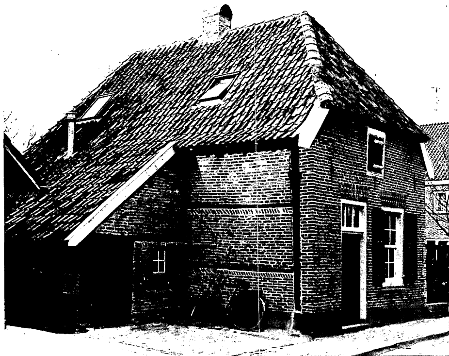
Gezinsvervangend tehuis 'Kupershuusten', een rijksmonument.