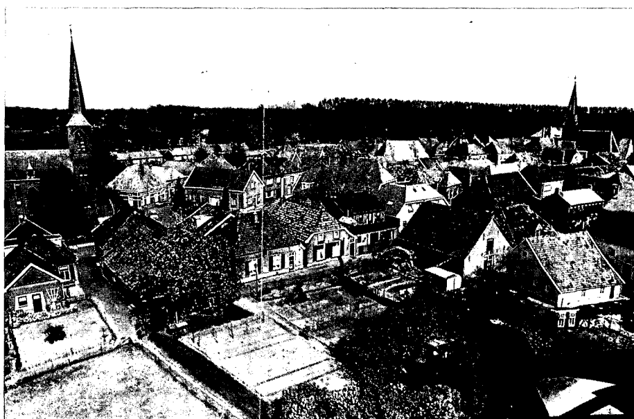
Overzicht vanuit de lucht van Bredevoort.

gel niet alleen veruit de lelijkste gebouwtjes van het dorp neergezet, maar gewoonlijk ook de meest prominente locaties veroverd.