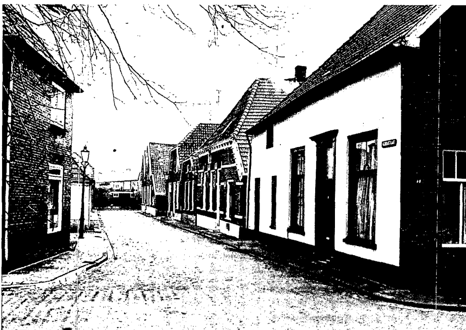
Doorkijkje in de Hozenstraat.