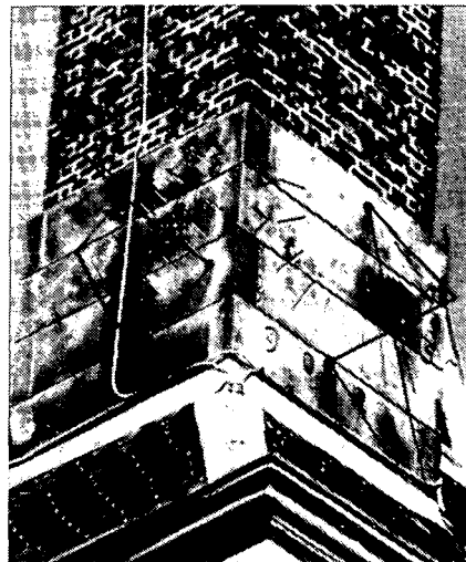
ONTSIERDE ZONNEWIJZER AAN HET GRAVENSTEEN IN LEIDEN (WEST- EN ZUIDWIJZER)

Zijn het geen monumentjes van geschiedenis en kunst? En toch worden ze vaak niet vermeld in het „Kunstreisboek voor Nederland”, en zelfs niet altijd in de „Geïllustreerde Beschrijving der Nederlandse Monumenten van Geschiedenis en Kunst”.