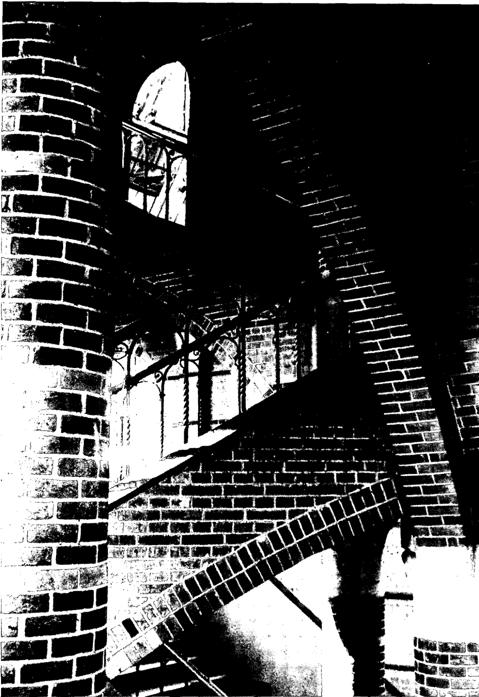
De parel van het complex: de monumentale Trappenhal met kunstsmeedwerk en verfijnd natuursteen- en schoonmetselwerk.

particuliere stichting notabene heeft de initiatieven ontwikkeld en door een zakelijke aanpak de diverse instellingen zo enthousiast gekregen, dat men medewerking toezegde. Uit het juli-nummer van Heemschut, waarin de herbestemming van de Prins Frederikazerne te Leeuwarden aan bod kwam, blijkt dat we niet van uitzonderingsgevallen spreken. Ook hier is de verbouwing – tot woon-eenheden – financieel mogelijk gemaakt door Volkshuisvesting en Monumentenzorg. 11 Tot slot kunnen we nog op een Limburgs voorbeeld wijzen: de herinrichting van het voormalige Ursulinencomplex te Eysden tot gemeentehuis, dankzij het aanspreken van de verschillende subsidiepotten, waaronder die van Monumentenzorg. 12 De moraal is, dat wie met een goed plan komt, waarin de monumentwaarden optimaal worden ge-