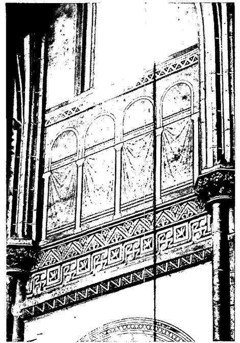
Geschilderd schijntriforium in de lichtbeuk uit het tweede Cuypers-concept, bestaande uit geschilderd blokverband, met dieren bevolkte meanders, en een boogstelling met gordijnen.

De Cuypers-polychromie is een karakteristiek voorbeeld van de wijze waarop men in de late 19de eeuw met warme tinten, zware en strak belijnde vormen aan een interieur warmte en monumentaliteit trachtte te geven. De helderheid der kleuren is nog steeds zichtbaar als direct zonlicht in het gebouw valt: het kleurengamma verrast dan door zijn ongewone felheid, zoals ook de rapporteurs erkennen. De auteurs van het restauratierapport hebben echter niet door de vette vervuilingslaag heen kunnen zien getuige hun karakteristieken van de uitmontering. Deze