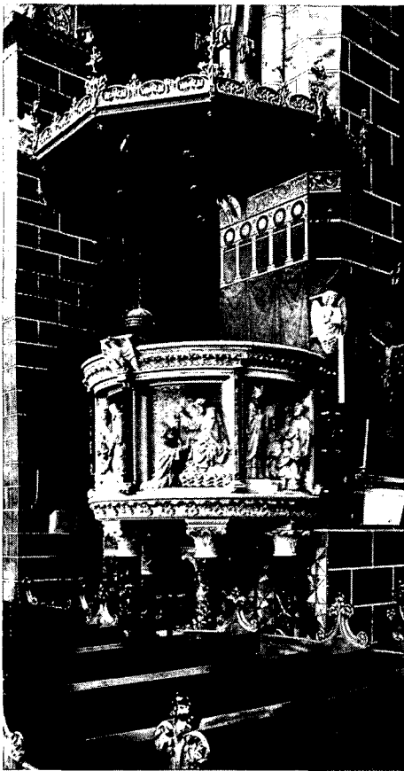
De preekstoel van St. Servaes uit 1868, harmonisch opgenomen in de aangepaste omgeving van 1868.