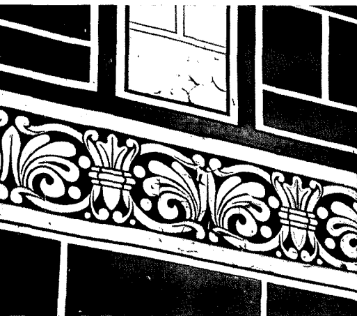
Detail van een ornamentband, die karakteristiek is voor de vlakke, lineaire schilderwijze van de neogotiek in de late 19e eeuw (Foto W. van Leeuwen 1983).

vaas ruimtelijk nooit een eenheid heeft gevormd, maar een opeenvolging is geweest van door hekken en afscheidingen verdeelde ruimte.