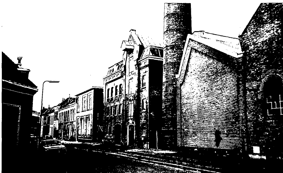
De Bergpoortstraat.

Een smalle grauwe fabrieksstraat uit het eind van de vorige eeuw. Aan de ene kant de rij somber ogende, verwaarloosde fabrieksgebouwen, daartegenover de kleine fabriekswoningen. Het staat er allemaal nog, aan de Bergpoortstraat in Deventer. Of dit zeldzame toonbeeld van ons industriële verleden ook blijft, is onzeker. Want onlangs heeft Deventer een vernieuwingsplan in hoofdlijnen voor de Raambuurt, de oude industriewijk, op tafel gelegd. Vooralsnog lijkt de kans klein dat deze unieke fabrieksstraat behouden kan blijven. Maar dat kan veranderen, meent de Stichting Industrieel Erfgoed Deventer.