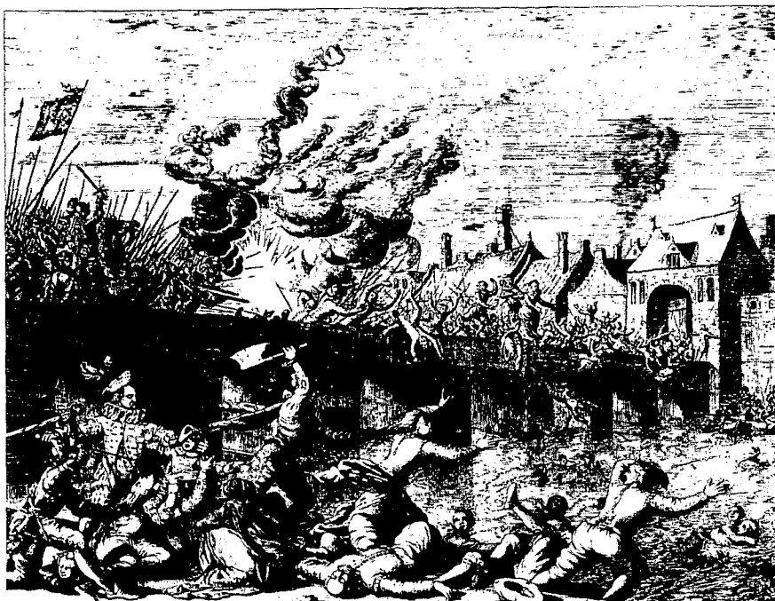
Gevecht op de Maasbrug tijdens de inname van Maastricht door de Spanjaarden in 1579. Prent uit ca 1700 van Jan Kuyken. Opschrift prent: "Maastricht door den prins van Parma stormender handt overweldight in den jaar MDLXXIX, den 29 van Julius."

van een jachthaven en de inrichting van de dagstranden. Initiatiefnemer van het project was de Pietersplas B.V., een particuliere organisatie die het gehele ontwikkelingsproject zou gaan leiden. Pietersplas B.V. had niet alleen de omliggende wateren van ca.