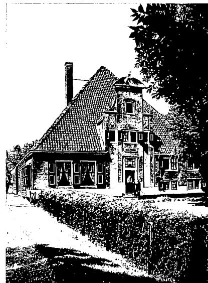
Boerderij De Eenhoorn uit 1682 in Midden-Beemster, één van de weinige overgebleven hereboerderijen.

boomgaarden, koetshuizen, poortgebouwen en moestuinen- rest alleen nog een maquette in het VVV-kantoor in Middenbeemster. Nu was de bereikbaarheid van Haarlem en omgeving vanuit Amsterdam ook wel wat beter dan die van de Beemster, waar Betje Wolff haar woning later had, nu museum. Pas in 1840 is men in de Beemster met de bestrating begonnen en vóór die tijd leek de weg ernaartoe en ter plaatse meer op een modderpoel. Maar de bestrating kwam te laat want de laatste buitens werden tussen 1800 en 1805 afgebroken. Een enkele prent en namen als Vredenburg, Zwaansvliet, Jagerslust en Belvliet resten ons nog. Slechts een oranjerie bij Vredenburg, waarvoor onlangs een sloopvergunning is afgegeven, is als u snel bent nog te zien. Vredenburg aan de Zuiderweg werd door Pieter Post, die samen met Jacob van Campen tot de beroemdste architecten behoorde van de 17de eeuw, in 1642 ontworpen voor Frederick