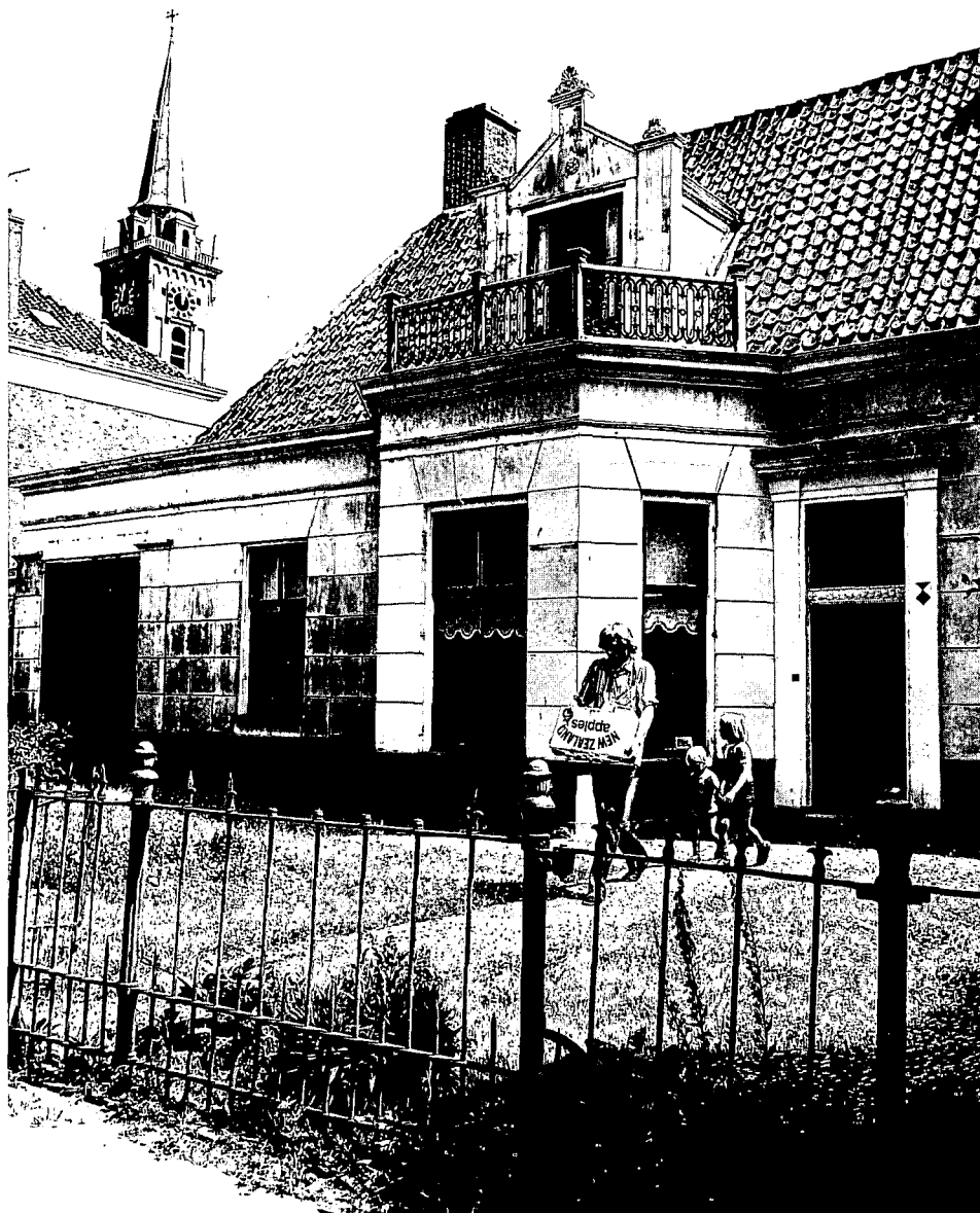
De voormalige Doopsgezinde Kerk in Midden-Beemster, waarin nu het Betje Wolff Museum is gevestigd.

morgen duurt), 111 binnenkavels van 20 morgen en 111 kavels van 2 morgen, de zogenaamde Purmerender kavels, waar groente verbouwd werd en fruit gekweekt, waaraan de Beemster zo rijk is. De Purmerender markt kreeg zo'n immense aanvoer, dat de stad al kort na de drooglegging octrooi aanvraag voor uitbreiding. Van daar werd het fruit naar de Warmoes (= groente) straat in Amsterdam vervoerd.