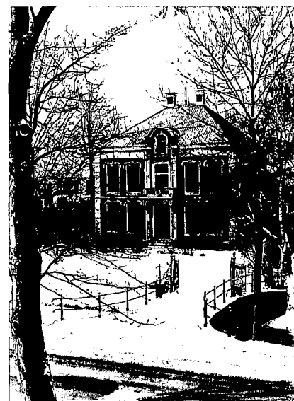
Oud polderhuis in Midden-Beemster.

Met dank aan de heer J. de Groot te Middenbeemster, bestuurslid van het Museum Betje Wolff en bestuurslid van de Stichting tot Behoud van de Historische Schoonheid van de Beemster.