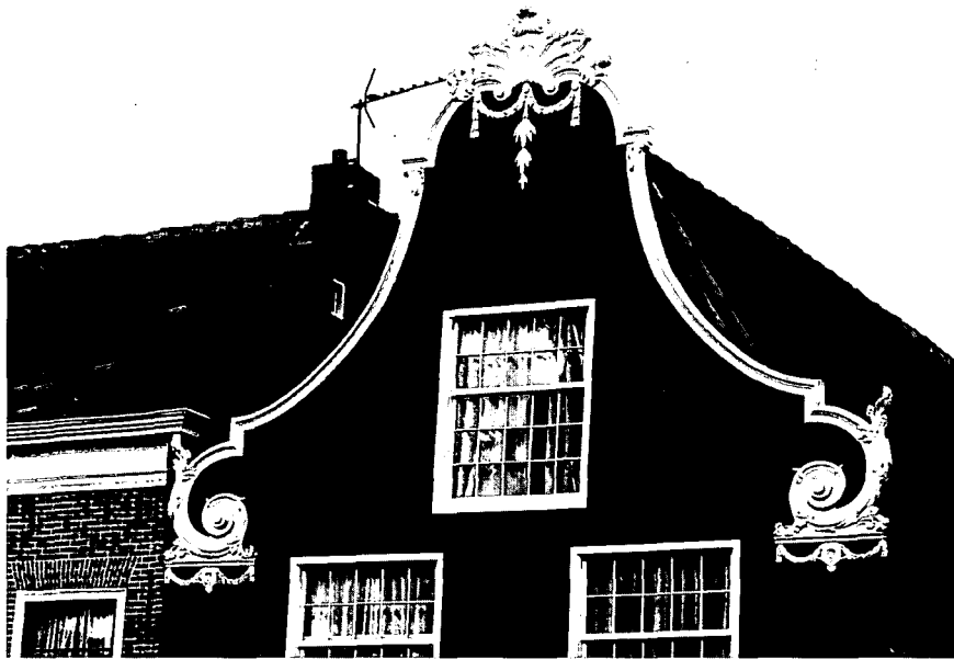
Nieuwe houten gevelbekroning woonhuis De Rijp (NH).