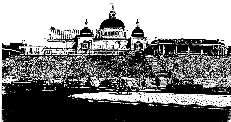
Het gesloopte theater/restaurant Seinpost.

Het duidelijkst is het dalprofiel doorgevoerd aan de landzijde. Het enorme en lege Gevers Deynootplein werd volgebouwd om ineen te schrompelen tot een voorpleintje pal voor de hoofdingang van het Kurhaus. De langgerekte vleugels van het Kurhaus gaan geheel schuil