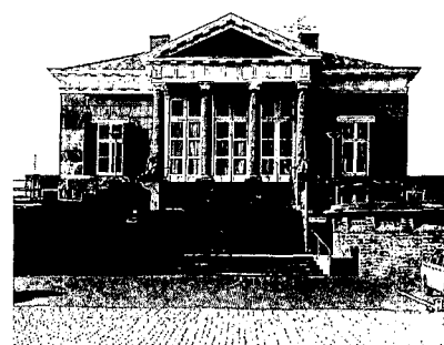
Paviljoen Von Wied.