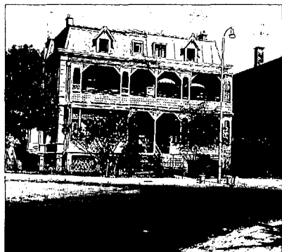
Belgischeplein 31 t/m 33

ge problemen. Vooral in het geval van het Palace-Hotel betekende dat een groot verlies. Vanuit een zuiver bouwkundig standpunt gezien was het Palace-Hotel van architect Van