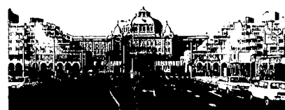
Het nieuwe Gevers Deynootplein.

In het Kurhaus uit 1885 van de Duitse architecten Henkenhaf en Ebert gaat deze luchtigheid op een merkwaardige wijze samen met een streven naar monumentaliteit. Het hotel straalt een triomfantelijke grootsheid uit door de streng symmetrische ordening van de bouwmassa's, de strak geordende raamtraveeën, de uitspringende middenpartij en uiteraard de grote achthoekige koepel, geflankeerd door vier hoekpaviljoens. Het gebouw is duidelijk bedoeld als het centrum van de badplaats. Aan de zeezijde evenwel, waar zich de duurste hotelkamers en suites bevonden, wordt de massiviteit van de gevels doorbroken door hoge arcaderijden. De hotelgasten kunnen door de openstaande balkondeuren direct van de zilte zeelucht genieten. En voor de architectuur liefhebber ontstaat daardoor een boeiend contrast met de geslotenheid van de zijarmen. Verder wordt met de detaillering een speels effect bereikt: de gevels zijn opgemetseld in roodgele verblend-