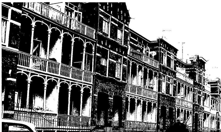
Dirk Hogeraadstraat 122 t/m 154

Met dank aan drs. Christiaan Vaillant, architectuurhistoricus Gemeente Den Haag.