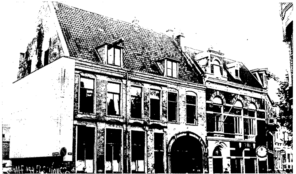
4. Wed 3, 5 en 7 in 1969. Wed 9 is, met de hele westelijke huizenrij van de Korte Nieuwstraat, afgebroken. Wed 5 en 7 staan er onderkomen bij.

Een stad is geen verzameling losse gebouwen, er zit een door de eeuwen heen gegroeide structuur in. In de binnenstad van Utrecht is daarvan nog zóveel bewaard gebleven, dat al in 1976 vrijwel het gehele gebied binnen de singels tot Beschermd