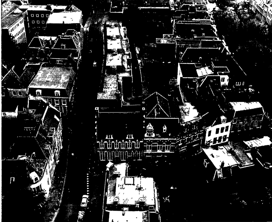
5. Gezicht vanaf de Domtoren op de Korte Nieuwstraat in 1986. Op de voorgrond: Wed 5 en 7 in gerestaureerde toestand. De westwand van de Korte Nieuwstraat is weer bebouwd: de stadsstructuur is hersteld.

Hieronder volgt een lijstje van nog verkrijgbare publicaties die met medewerking van de onderafdeling of door medewerkers ervan verschenen zijn. Twee van die lijst verdienen enige extra aandacht. In samenwerking met de Rijksdienst voor de Monumentenzorg zal in het begin van volgend jaar een deel van de Geïllustreerde Beschrijving van de Monumenten van Geschiedenis en Kunst verschijnen dat geheel gewijd is aan de oude woonhuizen van Utrecht. Het is