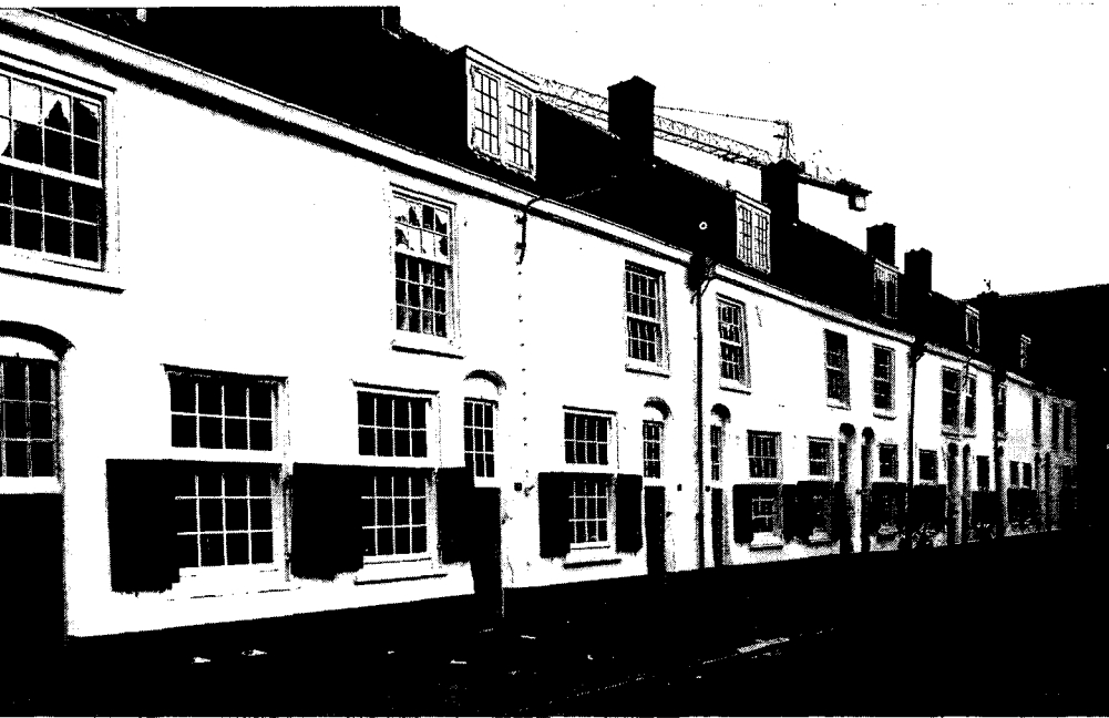
2. De Mieropskamers aan de Springweg na de restauratie.

architect, die zich voornamelijk met de monumenten in gemeentelijk bezit bezig hield en houdt, een adviseur voor particuliere restauraties toegevoegd. Daarmee ontstond een hoofdingeling die nu nog bestaat in de onderafdeling, nl. een architectenbureau voor de gemeentelijke monumentale panden en een publiekrechtelijk deel.