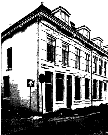
7. Maliebaan 16: een jonger monument.

Monumenten. Verkrijgbaar bij het Gemeentelijk Informatie Centrum, Vredenburg 90, Utrecht. Tel. 030-315415. Prijs f 10,-