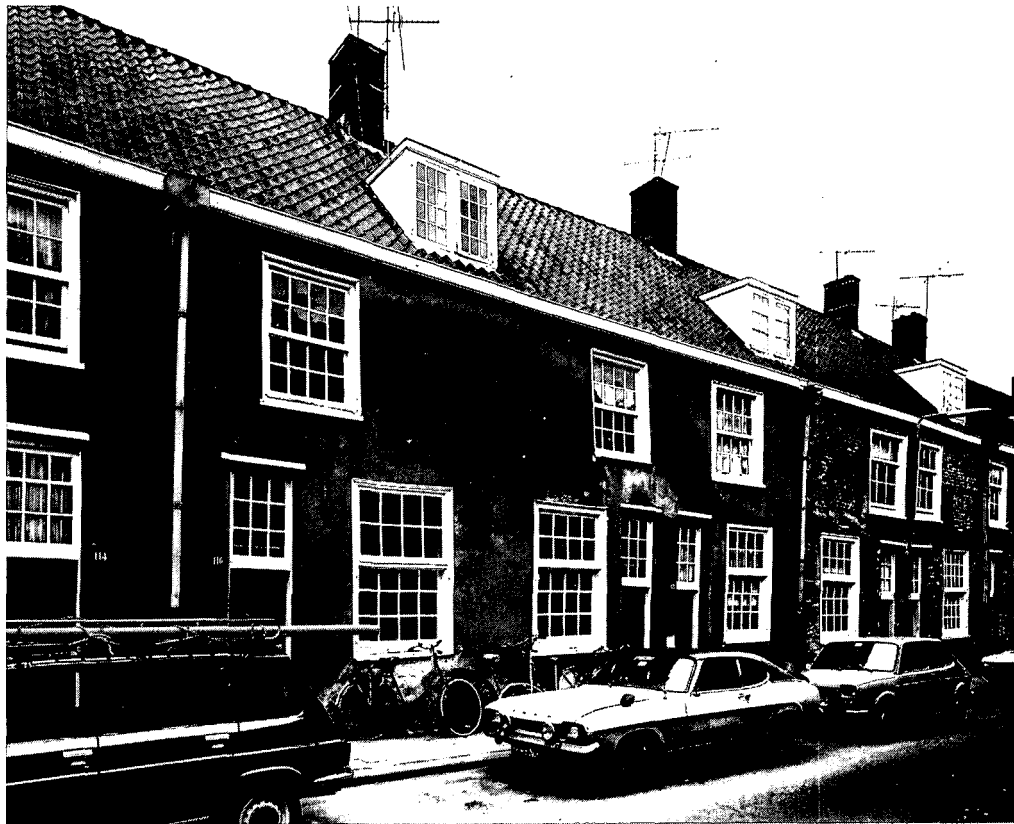
1. De Mieropskameren aan de Springweg vóór de restauratie.

De late jaren zestig zagen op veel gebieden in het maatschappelijk leven een grote ommekeer. Zo is in Utrecht o.a. een groeiende publieke belangstelling voor het welzijn van de oude stad merkbaar, wat vooral tot uiting kwam in zeer welbespraakte en gedreven actiegroepen. Met die groepen ontstond, na een korte tijd van 'gewenning' al spoedig een zeer werkbare verhouding. Pièce de résistance was het behoud van het middeleeuwse huis Achter Clarenburg 2, dat door