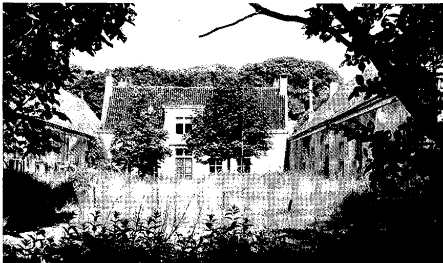
2 NOG VÓÓR KAREOL VAN DE LIJST VAN BESCHERMDE MONUMENTEN WAS AFGEVOERD TOONDE OOK HET INTERIEUR REEDS ALLE TEKENEN VAN VANDALISME. ZOALS OP DEZE FOTO DE EETKAMER.