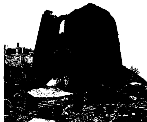
Restanten van de Eendracht eind april 1996.

Bestaande windmolens kunnen vrijwel zeker zijn van hun voortbestaan, maar molenrompen of molenstompen vallen veelal niet onder enige bescherming. In 1990 zag een projectontwikkelaar brood in de schitterend gelegen locatie met zijn fraaie uitzicht, kocht het terrein met de daarop staande molenromp van de eigenaresse en liet de gemeente het bestemmingsplan wijzigen. De Vereniging 'Oud-Wageningen'