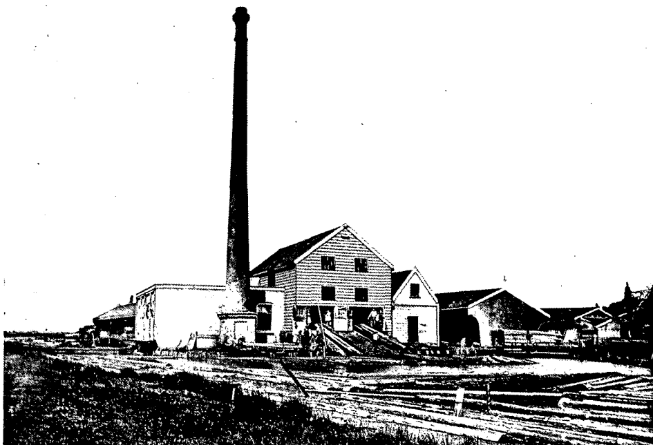
De Stoomhoutzagerij Voorwaarts' van Cornelis Vis en Zoon, Zaandijk.

De MBTZ beschikt reeds over een eigen kantoor- en archiefruimte, maar toch is dat niet voldoende. 'Te vaak moeten wij de