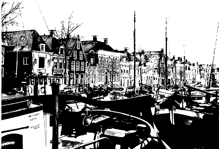
Deel van het beschermd stadsgezicht van Harlingen

Het planinstrument 'beschermd stads- en dorpsgezicht' bestaat uit de aanwijzing en inschrijving als beschermd gezicht; daaraan gekoppeld is de verplichting een be-