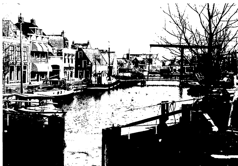
Deel van het beschermde stadsgezicht van Makkum