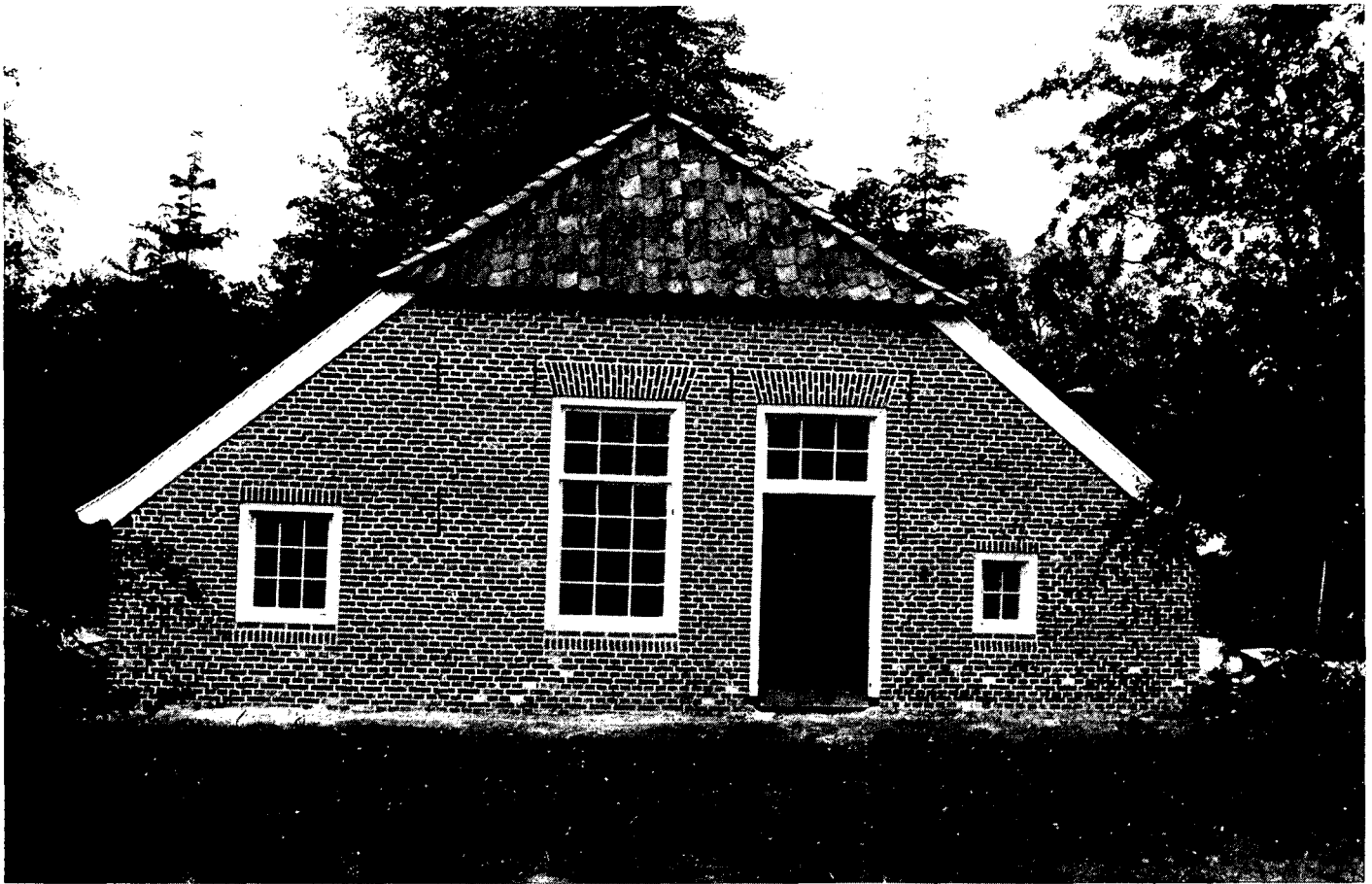
Toestand woongevel ná de restauratie in 1988.