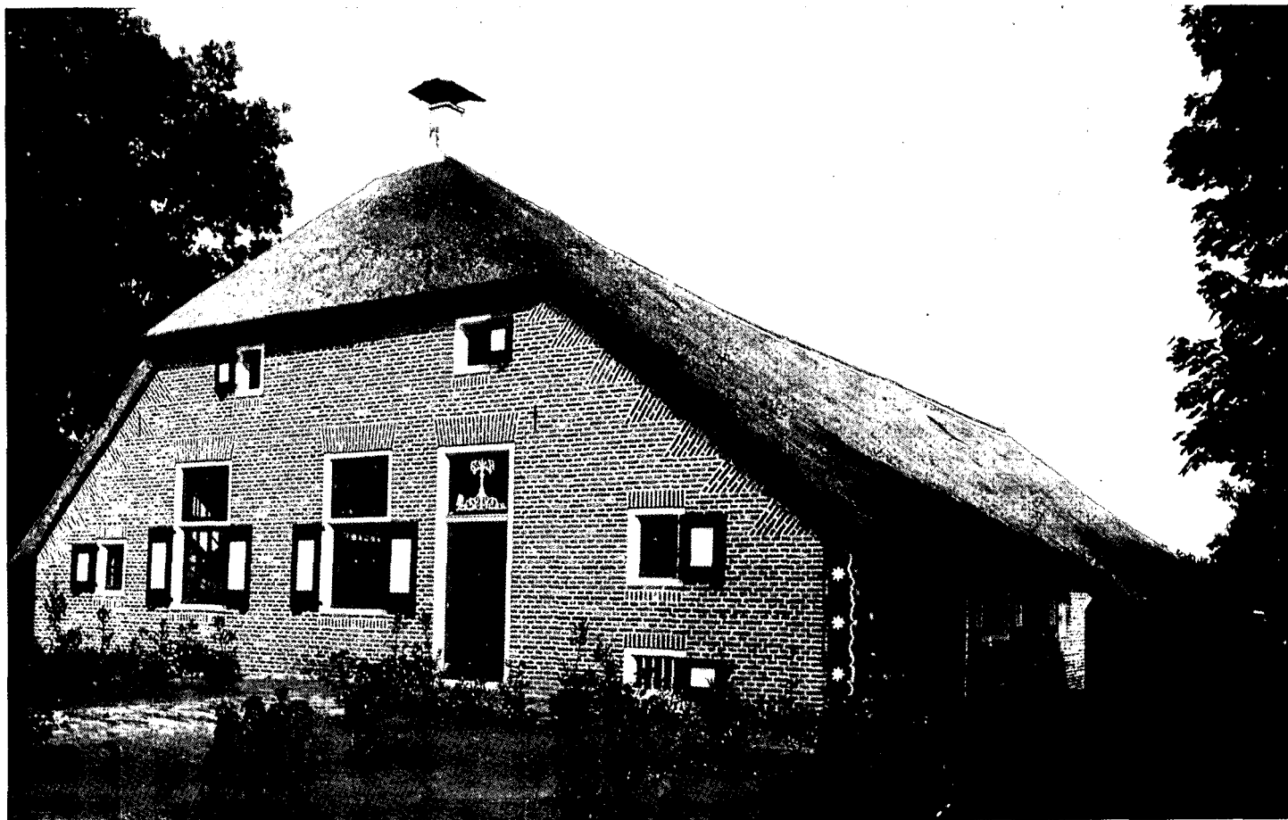
Gerestaureerde museumboerderij (woongevel), Gemeenteweg 67, Staphorst.

De stookplaats onder de schouw bezit een open vuur, vuurhaal (smeedijzer) en de zogenaamde vuurkorf, een stulp van smeedijzer, om het vuur 's nachts te beschutten (tegen brandgevaar). Verder zijn nog ver-