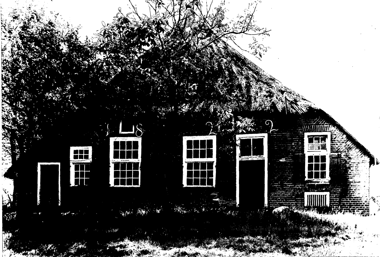
Nog niet opgeknapt, verwaarloosde Staphorster boerderijgevel met jaarankers 1822. Woldak van riet.

Grasland met rundveehouderij is de belangrijkste bestaansbron in Staphorst-Rouveen. De grootste oppervlakte bouwland werd in grasland omgezet.