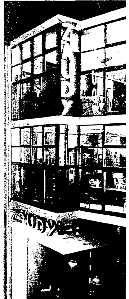
De winkelpui van de firma Zaudy in Wezel (West-Duitsland).

De eerste maquette van G. Rietveld van een winkel is een model voor een juwelierswinkel uit 1920-'22. Voor deze zaak ontwierp hij ook tot elementaire