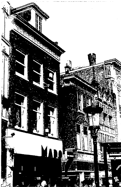
De kantoorboekhandel MADO aan de Oudegracht 119 in Utrecht met pui van Rietveld.

De ontwikkeling van de glasfabricage heeft grote invloed gehad op de vormgeving en de grootte van de winkelpui tussen 1800 en nu. De 'kleine ruitjes' ontstonden niet uit romantische overwegingen, maar door het bewust aan elkaar schakelen van bescheiden glasmatten, zodat een groter transport vlak voor lichtinval kon ontstaan. De in-