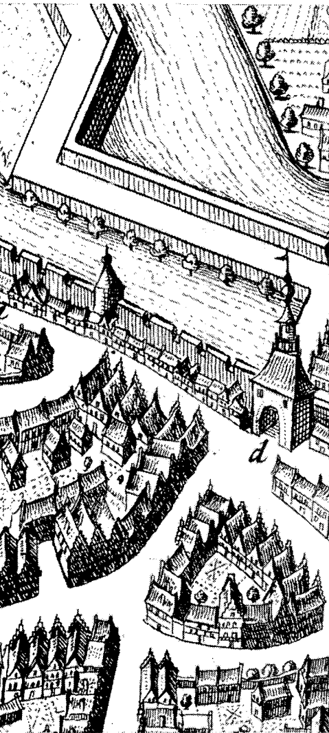
Deel van de stadsplattegrond van Zutphen door Nic. van Geelkercken; uitg. Joh. Blaeu. In het centrum het Adamansklooster

volstrekt betrouwbare en voldoende gegevens omtrent de oude toestand gevonden. Men behoeft de afbeeldingen slechts te vergelijken om te zien welk een spectaculair resultaat de restauratie had.