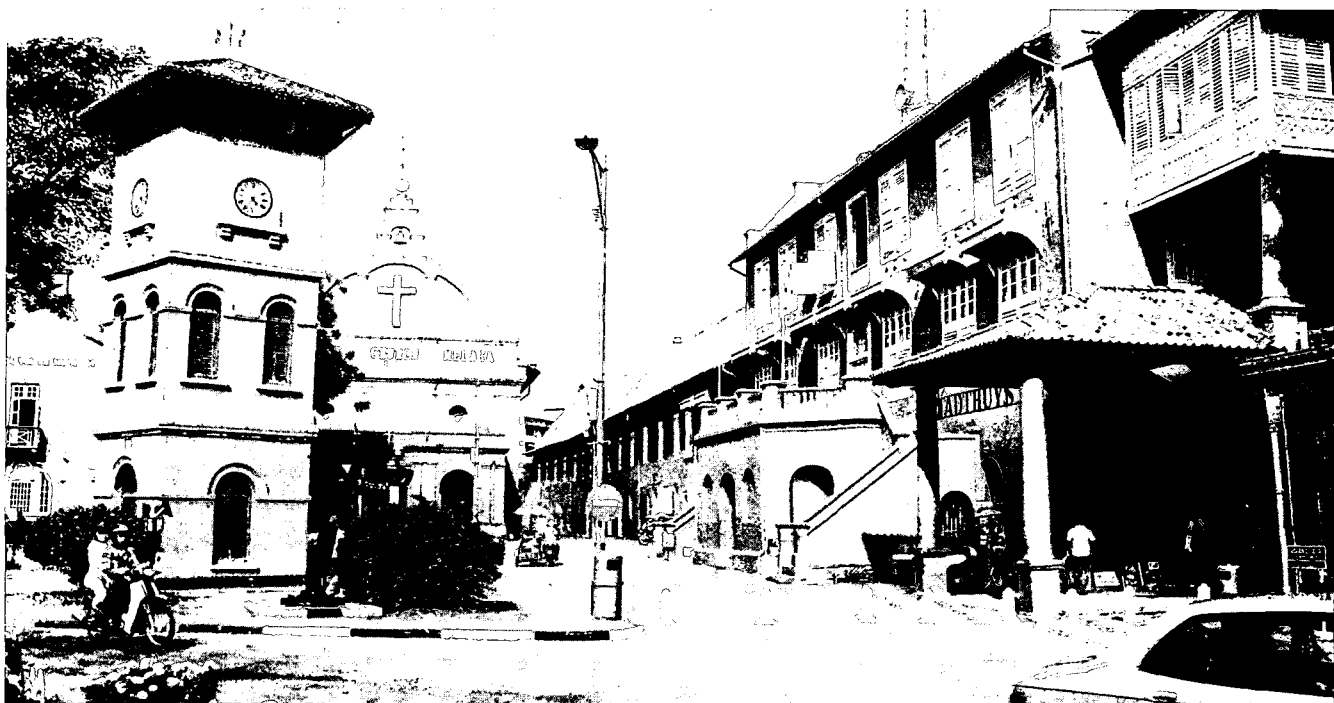
Stadhuys, Christelijke Kerk en Tan Beng Swee Clock Tower in Melaka.