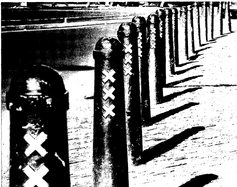
Een rij 'amsterdammertjes' langs een Amsterdamse straat. Dit straatmeubilair dient om fout parkeren tegen te gaan. De paaltjes worden echter nogal eens omver gereden.

Hij wijst erop, dat de 80.000 lantarens in Amsterdam een gigantisch kapitaal vertegenwoordigen en dat de gemeente er daarom zuinig op is. In de stad worden zoveel mogelijk de oude typen, die van uitstekende kwaliteit zijn gehandhaafd. Alleen aan