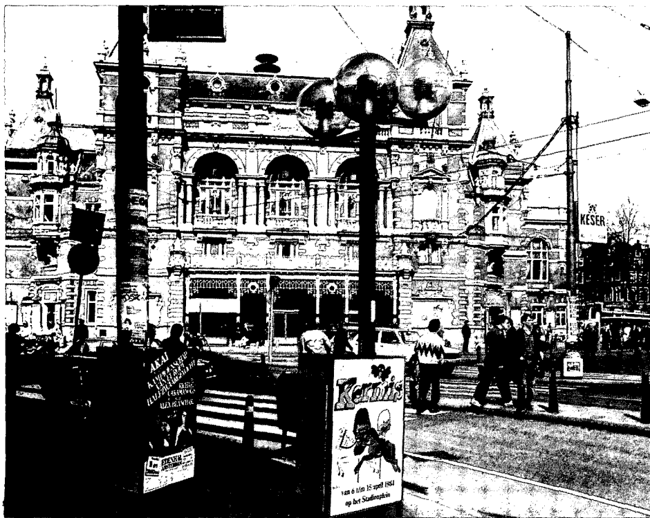
Gezicht op de Stadsschouwburg op de hoek van het Leidseplein en het kleine Gartmanplantsoen in Amsterdam. Een groot aantal straatmeubels (reclameborden, lantaarnpalen, verkeersborden etc.) beheerst het stadsbeeld. De opname is gemaakt in 1984.

Met die groei nam ook de bemoeienis van Publieke Werken toe. Gemeentelijke en in opdracht werkende architecten als Van der Mey en Kramer ontwierpen straatmeubilair