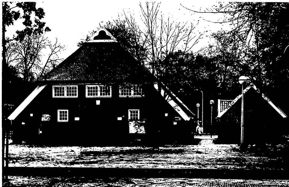
Geslaagd voorbeeld van hergebruik van een oude boerderij. Een als oudheidkamer ingerichte boerderij in het centrum van Emmen. Op de foto de achtergevel

Fel wordt tenslotte De Vroome als we de houtwallen ter sprake brengen: als vee- en wering opgeworpen wallen die vroeger beplant werden. Uit de fondsen van het Integraal Structurenplan Noorden des lands worden miljoenen uitgekeerd om deze wallen te 'fatsoeneren'. Elke tak, die maar even over het land hangt wordt door veel boeren als schadelijk ervaren en op hun verzoek afgeschoren. Zo gaat veel prachtig groen verloren. Onnodig want onderzoek in Denemarken heeft uitgemaakt, dat deze cultuurhistorische waardevolle wallen juist als een goed windscherm fungeren waardoor het vee vroeger in het jaar de wei in kan en er langer kan blijven. Het overheidsgeld kan op dat punt dus beter worden besteed. Een aardige uitsmijter aan het slot van ons interview.