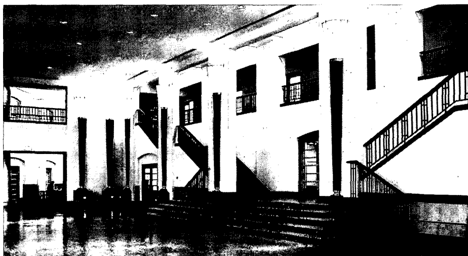
Zicht op de prachtige trap vanuit de nieuwe hal.

name groeften de geïnteresseerden voor het opvallende complex. Op de open dag, die het bedrijf organiseerde kwamen maar liefst 10.000 mensen en regelmatig worden er nu nog excursies gehouden voor architecten en bouwtechnisch geïnteresseerden. Er zijn al diverse mensen langs geweest, die met het gebouw reclame wilden maken maar Mexx zelf gebruikt haar onderkomen nog niet als zodanig.