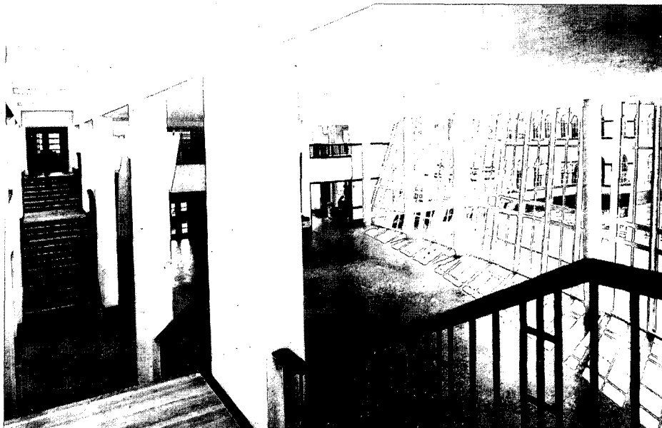
Doorkijkje vanaf de monumentale nieuwe trap naar de ruime hal.

fantastische ruimte-werking en zee van licht. In de hal met zijn monumentale nieuwe trap en omloop op de eerste verdieping komen alle verkeersroutes samen. Zonder expliciet beoogde functie fungeert de hal zo als centrale ontmoetingsruimte samen met het licht torenende restaurant, dat grenst aan de hal. In de hal wordt elk jaar de nieuwe mode van Mexx gepresenteerd en er vinden ook wel eens feestjes en lunches plaats maar voor de rest straalt de hal primair ruimte uit, wat prima aansluit op het mode-concept van jong, vrolijk en energiek. Restauratie en nieuwbouw hebben inclusief de inrichting een slordige 12 miljoen gekost, waarvoor geen cent subsidie werd verkregen. Wordt op die manier een monument economisch ten nutte gemaakt? vragen we office-manager Betty De Haan. Zeer zeker, zegt zij. We wilden niet voor niets een representatief hoofdkantoor, dat iets uitstraalt. Mexx kon toen niet vermoeden, dat haar nieuwe onderkomen zo sterk de aandacht op zich zou gaan vestigen. Al vóór de ingebruik-