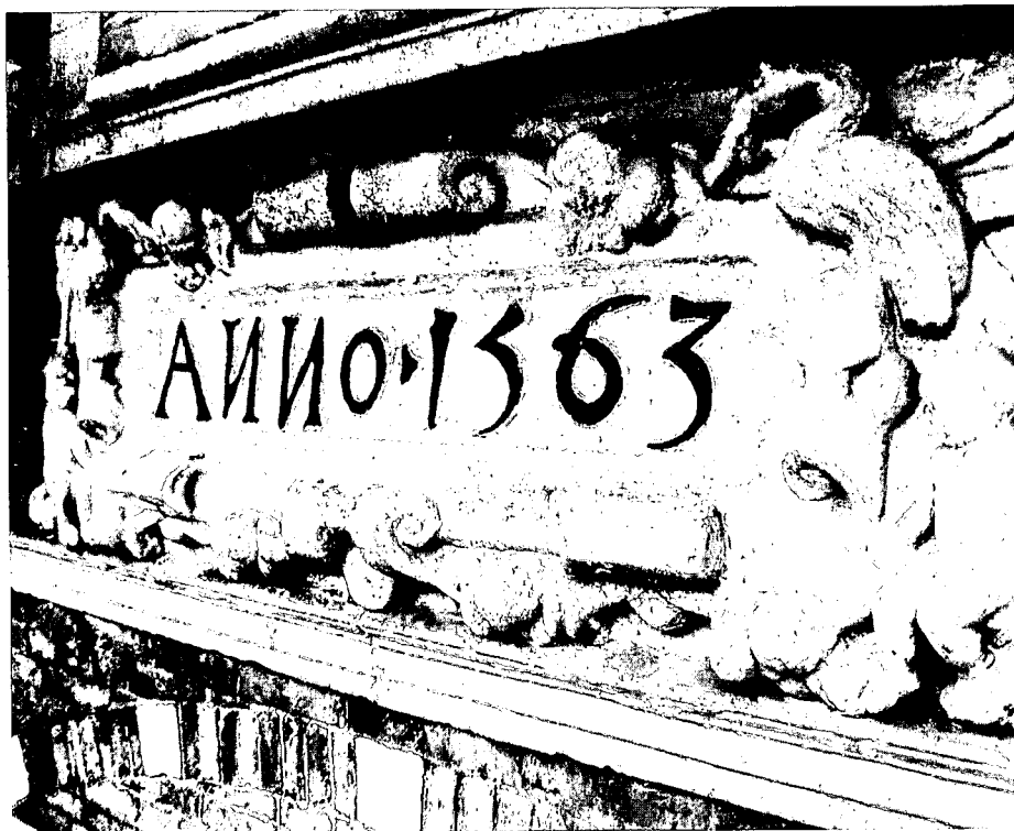
Gebeeldhouwd schild voorgevel.

en worden door frontons afgedekt evenals de ramen in de zij- en achtergevel. De trappen van de voorgevel zijn gevuld door zes saterfiguren, die zijn bewerkt op de wijze van