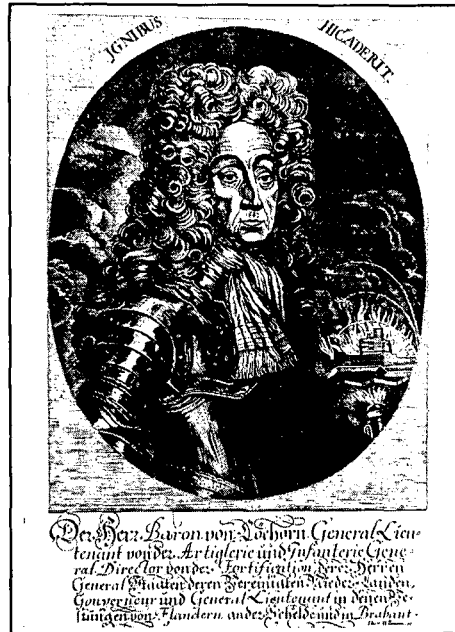
Menno Baron van Coehoorn (1641-1704) naar een gravure door Hieronymus Bollmann.

geving de gegevens, soms slechts onduidelijke sporen, kunnen proberen te ontdekken. Door de tentoonstelling 'Vesting' blijkt niet plotseling dat de Nederlanders krijgshaftige agressievelingen waren, maar wel dat ze door de eeuwen heen keurig op de handel hebben gepast door het aanleggen van allerlei soorten verdedigingswerken. In tegenstelling tot de ons omringende landen die krijgkundig mogelijk veel actiever waren is hier bovendien al vroeg het belang van de geschiedenis van de vestingbouw onderkend. De vesting Naarden was in 1927 de aanleiding voor een groep belangstellenden om eerst deze en later ook andere in onbruik geraakte militaire structuren te verdedigen