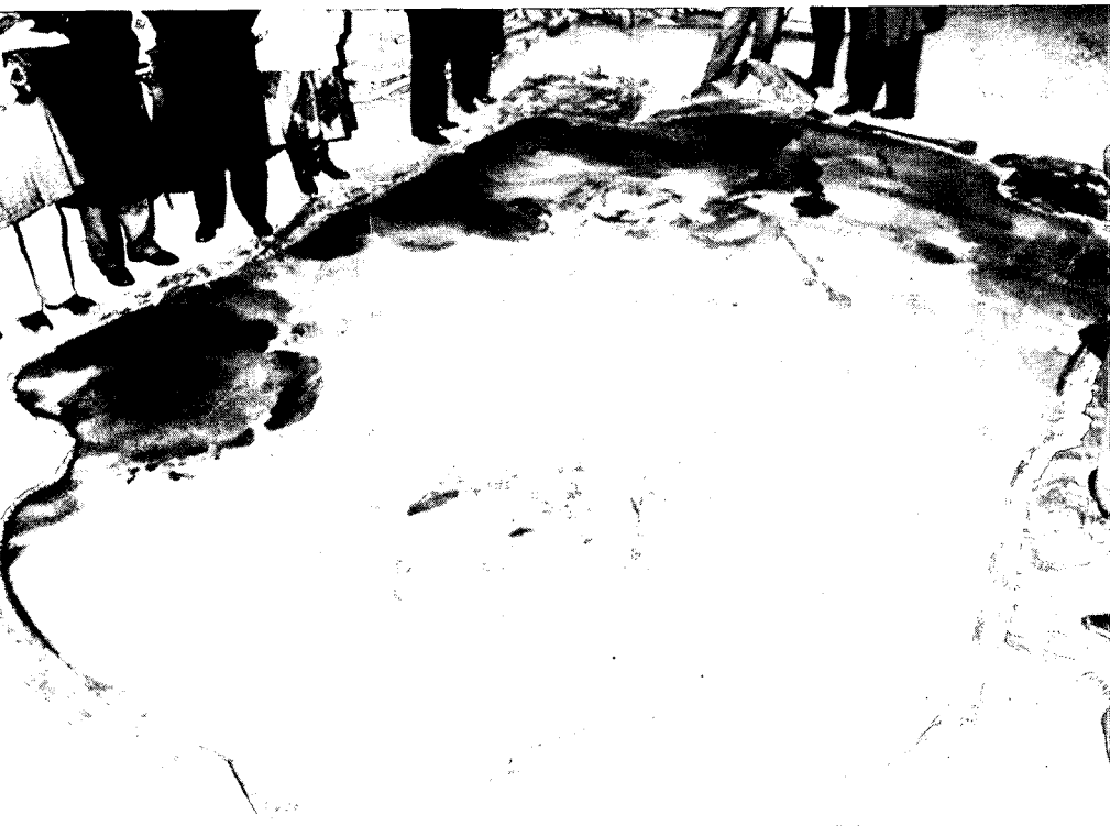
18-eeuws plafonddoek van Jacob de Wit voor het eerst na tientallen jaren opslag uitgerold.

Het doek werd omstreeks 1958 weer afgenomen om te worden gerestaureerd. Bij een totale renovatie van het pand omstreeks die tijd werd de grootte van de kamer echter (12 x 7 m.) als onpraktisch ervaren. Plannen om de zaal te halveren hadden tot gevolg dat het doek 'tijdelijk' werd opgeslagen.