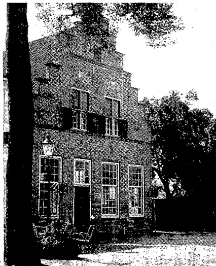
1 DE GROTE KERK EN HET OUDE RAADHUIS IN LOCHEM; BESCHERMDE MONUMENTEN

Deze thans verdwenen bouwwerken, waren alle monumenten die niet beschermd werden op grond van de Monumentenwet. De betekenis van dergelijke niet-beschermd gebouwen voor het stadsbeeld wordt in brede kring helaas te weinig beseft. De laatste jaren wint dan ook steeds meer de gedachte veld, dat de zorg voor de historische bebouwing niet voldoende is gewaarborgd met de door de Monumentenwet beschermde gebouwen. Niet alle historisch belangrijke zaken komen op de rijkslijst voor. Vooral ten aanzien van de bescherming van laat-19e-eeuwse en begin-20ste-eeuwse zaken heeft het rijksbeleid zich in Lochem nog niet uitgekristalliseerd. Daardoor kan bij een niet-beschermd stads- of dorpsge-