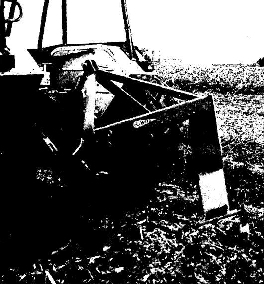
Zogenaamde woeler waarmee de grond tot op 70 cm kan worden losgemaakt, een normale agrarische activiteit waarbij onbewust archeologische sporen vernield kunnen worden.

recht naar mijn mening. Toch moeten we ervoor waken dat dit onderzoek ook in de toekomst nog voldoende mogelijkheden behoudt en dat de bron hiervan niet, of voor wat betreft bepaalde aspecten, opdroogt. Onderzoek alleen in grafheuvels en terpen, hoe profijtelijk ook, is nauwelijks een wenkend perspectief.