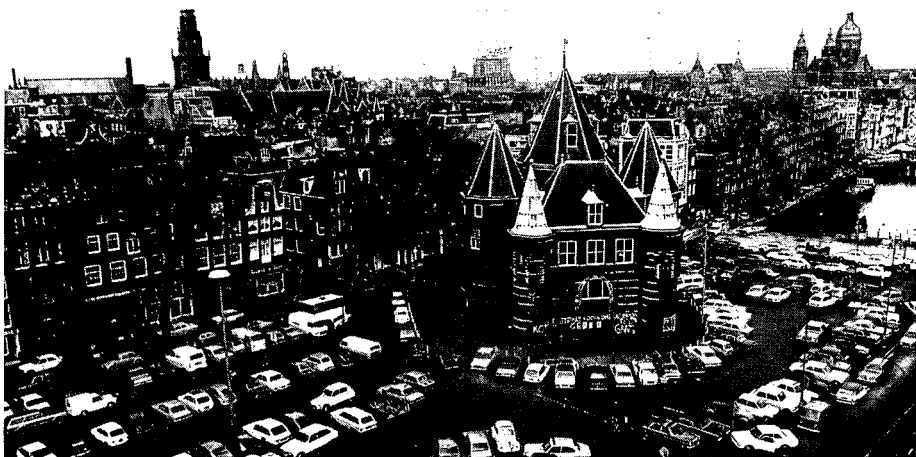
De Waag en omgeving vanuit de lucht gezien

geschilderde wapens van de chirurgijnen in het koepelgewelf zijn er nog. In deze ruimte worden conferenties gehouden. Ook in deze ruimte zal grote zorg worden besteed aan het behoud van deze wapens door zowel de temperatuur, de vochtigheidsgraad en het licht op een voor de wapens weinig kwetsbaar niveau te houden.