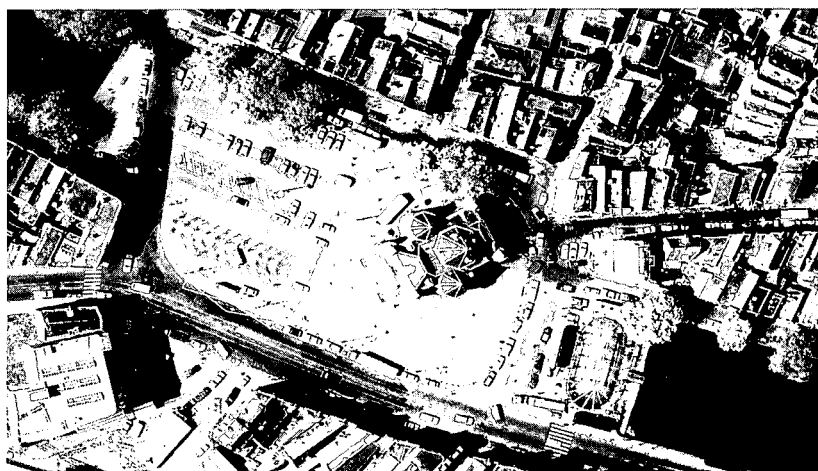
Nieuwmarkt in huidige situatie

Opvallend in het ontwerp van het plein is dat grote zorg is besteed aan de toegepaste bouwmaterialen en aan de vormgeving van de objecten en het straatmeubilair. Met dit nieuwe plein, waar de voetganger weer koning is, heeft de Nieuwmarktbuurt opnieuw zijn centrum terug.