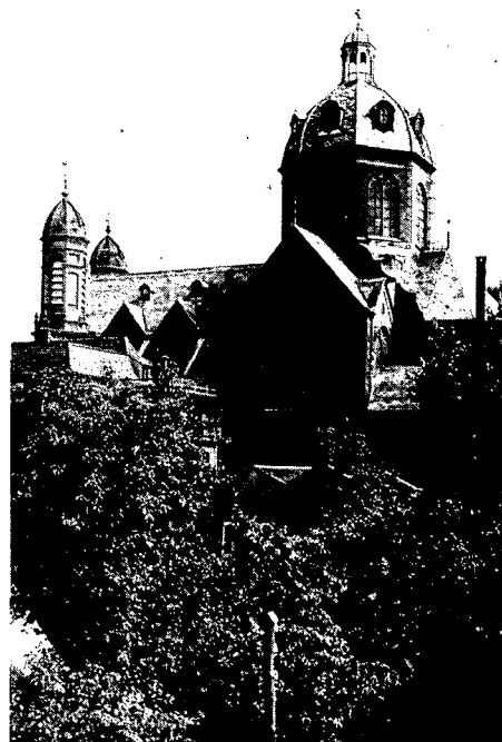
St. Cyriacuskerk te Hoorn (1879-1882).

Enige maanden na het ontstaan van de Hoornse stichting werd de Vriendenkring Nicolaaskerk Amsterdam opgericht, met een gelijke doelstelling, namelijk behoud en restauratie van de kerk. Met het laatste is al een begin gemaakt: een vrijwilliger brengt momenteel op knappe wijze de sja-bloonschilderingen weer in goede staat. Het wachten is nu op andere, eveneens noodzakelijke herstelwerkzaamheden. In de eerste plaats denkt men dan aan de restauratie en herplaatsing van de binnenkoepel van glas-in-lood. Dit jaar bestaat de St. Nicolaaskerk honderd jaar. Naast het organiseren van activiteiten bracht de