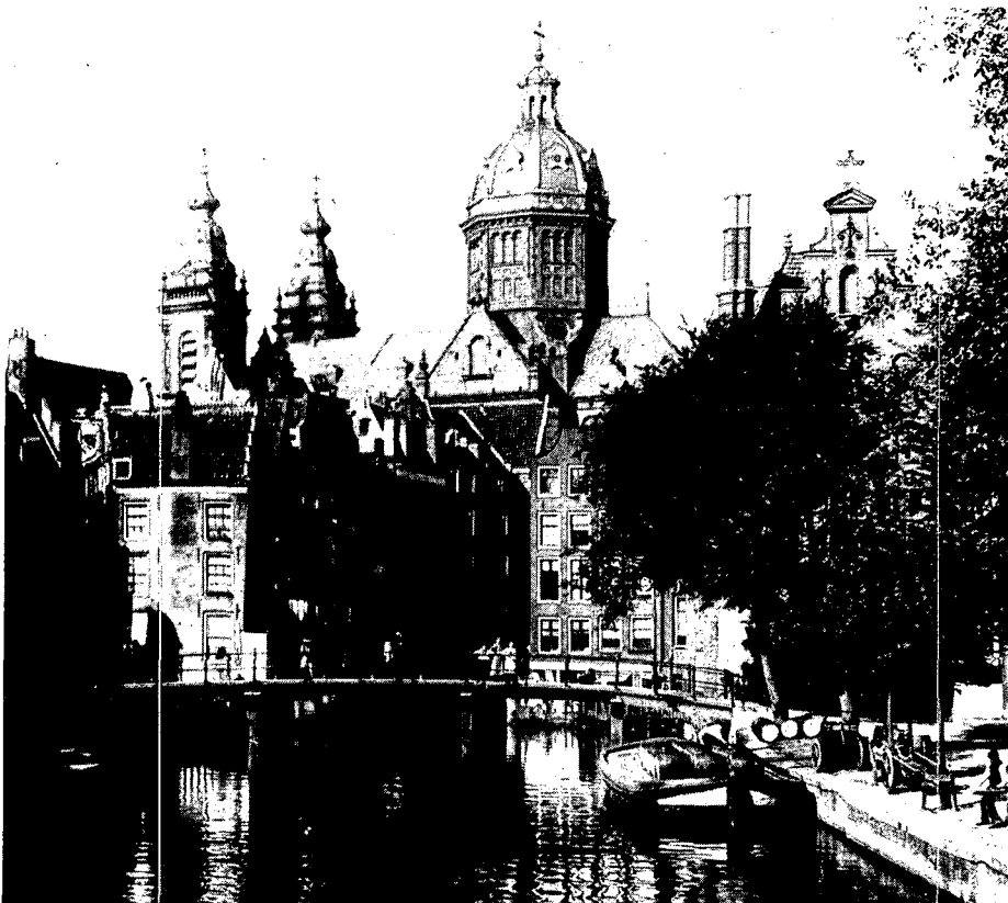
St. Nicolaaskerk te Amsterdam (1884-1887). Opvallend is de overeenkomst qua silhouet met de Hoornse kerk. Beide gebouwen doen het uitstekend in het stadsbeeld.