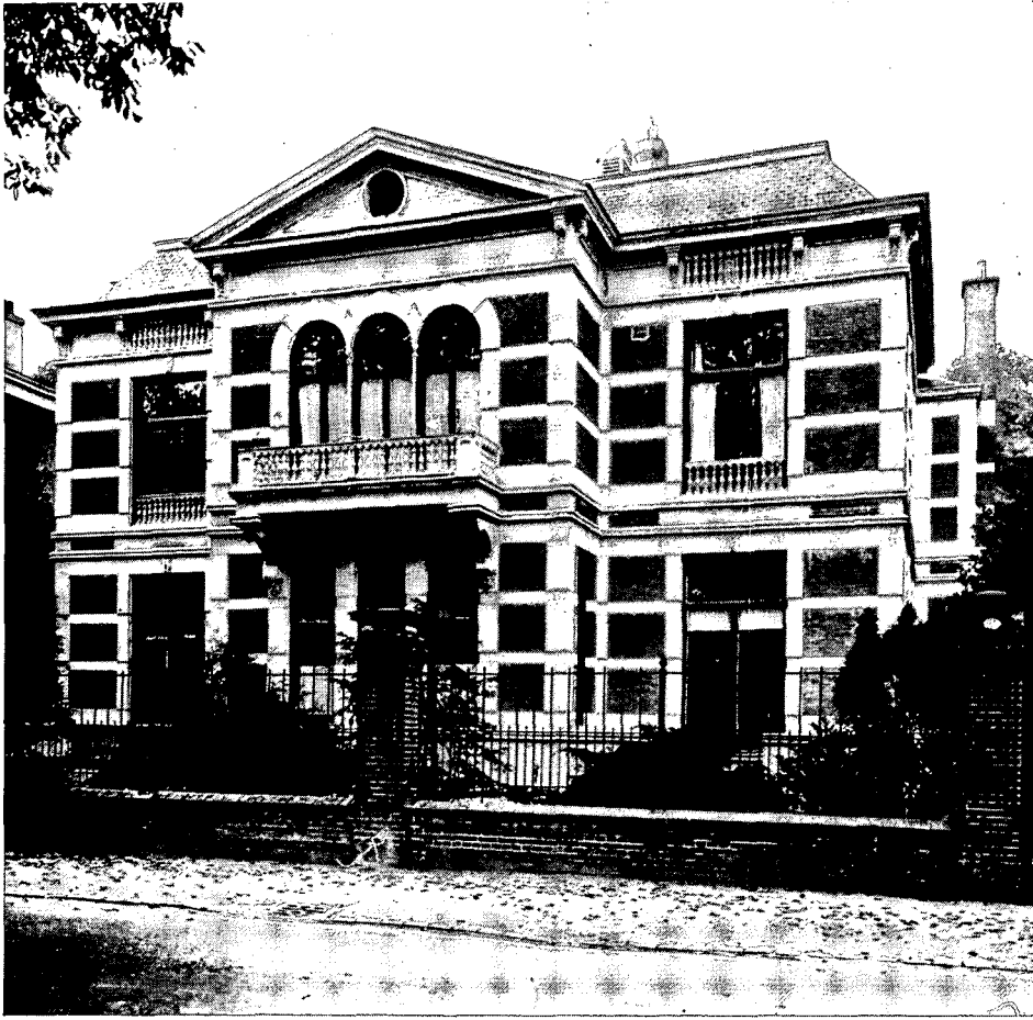
Een typerend voorbeeld van huizenbouw uit de begintijd van het Van Stolkpark, villa Duinoord, in 1882 gebouwd voor Edward van Hoboken (Van Stolkweg 6).

De schaalvergroting kwam in nog ernstiger vorm bij plannen voor uitbreiding van Sandhaghe (Hogeweg 18) met een observatie- en behandelcentrum voor geestelijk gehandicapte kinderen. Een gezamenlijk protest van de bewoners werd niet gehonoreerd, evenmin als een verzoek om inlichtingen over de plannen tot bouw van een bejaardencentrum aan de Duinweg.