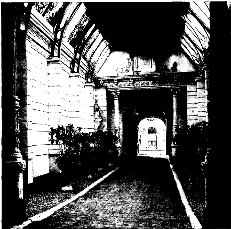
De doorgang van de Hollandsche Manège, vóór 1969.

Deze beschouwing werd geschreven voor de oorspronkelijk in september geplande Heemschutexcursie naar de Hollandsche Manège in het kader van 'Restauratie-aannemers presenteren zich.' Ook nú kan deze excursie nog niet plaats vinden, maar met de aannemer is afgesproken, dat zodra het gebouw weer behoorlijk toegankelijk is voor een groep bezoekers dit in ons excursieprogramma zal worden opgenomen.