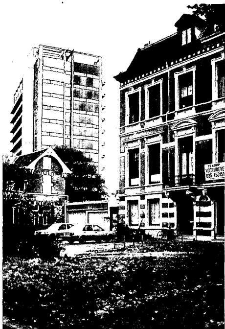
Velperweg. Tegenstellingen tussen laat-19e-eeuwse herenhuizen met diepe voortuinen en kantoorflats.