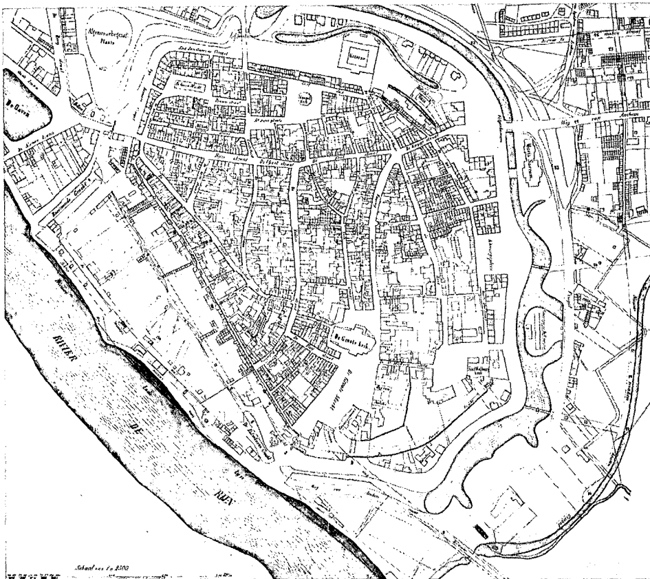
Plattegrond van Arnhem naar het plan van uitleg van Architect H. J. Heuvelink uit 1853.

restauratie gevierd, maar in 1973 viel de eerste rib alweer uit het gewelf. Tien jaar later is de kerk weer geopend. De restauratie en herbesteding voor culturele doeleinden is op zeer aanvechtbare wijze geschied: de raamtraceringen zijn in omvang verdubbeld ten behoeve van het aanbrengen van dubbel glas. Het interieur is een ware orgie van – overigens noodzakelijke – trekstangen, akoestische panelen en honderden meters