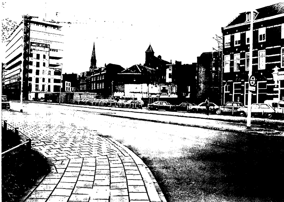
De oude stadsrand van de middeleeuwse stad aan de Oeverstraat. Hoogbouw, kaalslag en torentjes. Links de tot afbraak gedoemde Eusebiuskerk.

re geld dan met inachtneming van het aanwezige monumentenbestand.