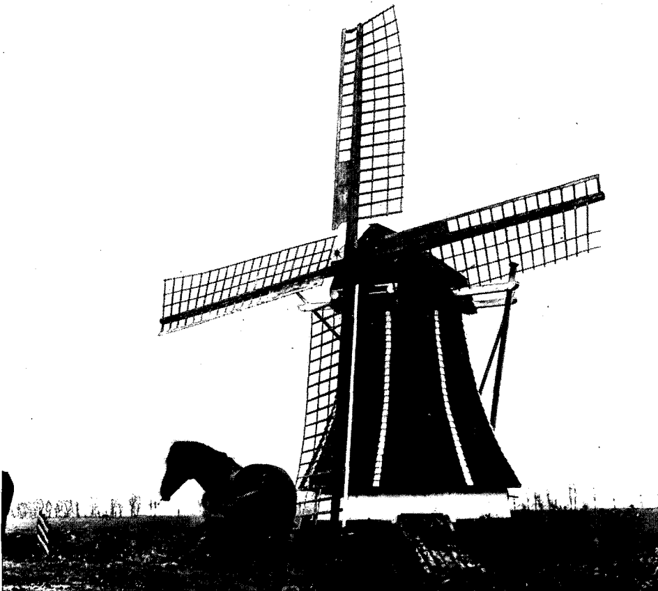
'Mounts' of monnikmolen, de achtkante grondzeiler Beintemapoldermolen uit 1870, gelegen ten noorden van Westergeest.