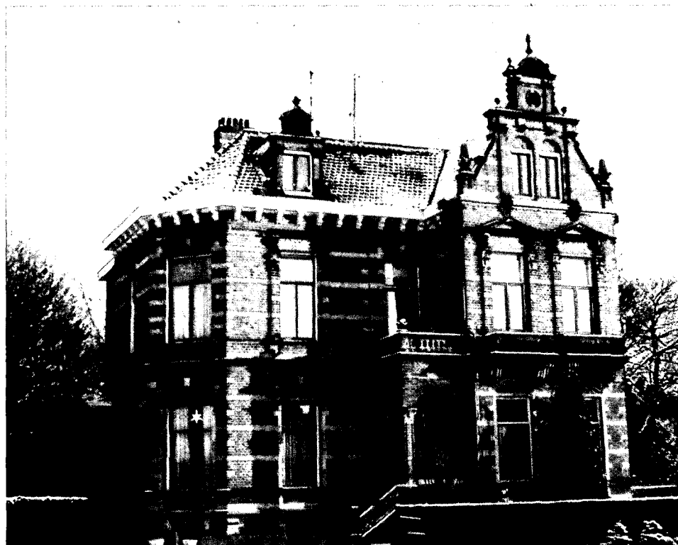
Villa van de hoofdingenieur van het GEB, gezien vanuit het Noordwesten