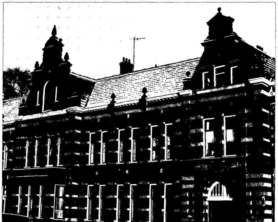
Kantoorgebouw van het GEB, gezien vanuit het Westen