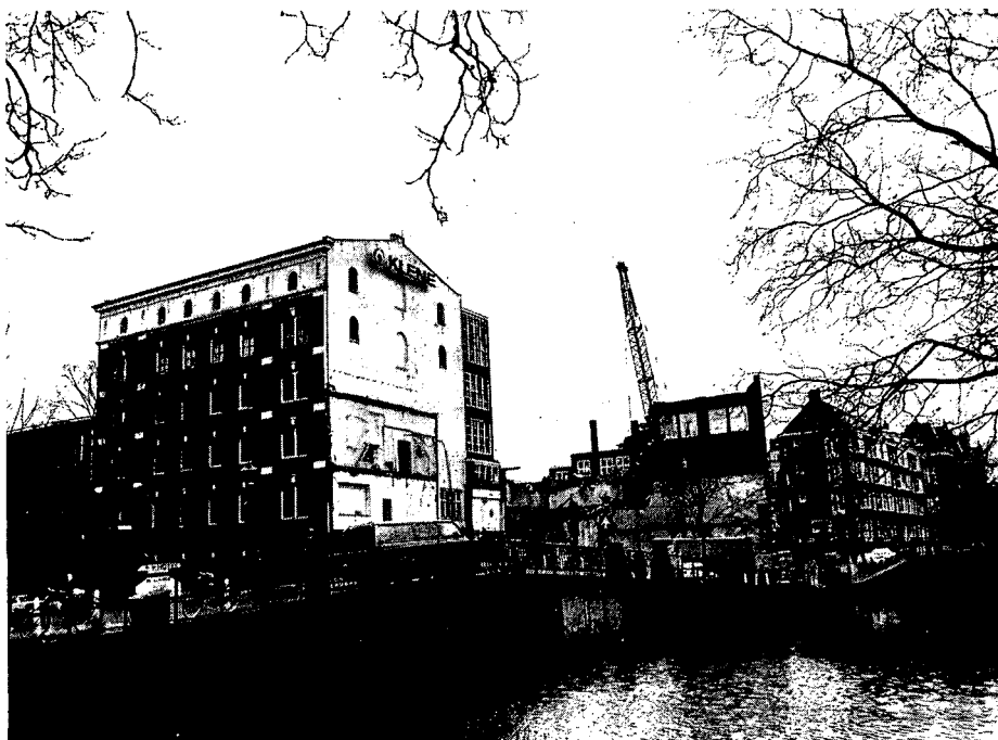
Restanten van het Klene-complex, de sloop is in volle gang.