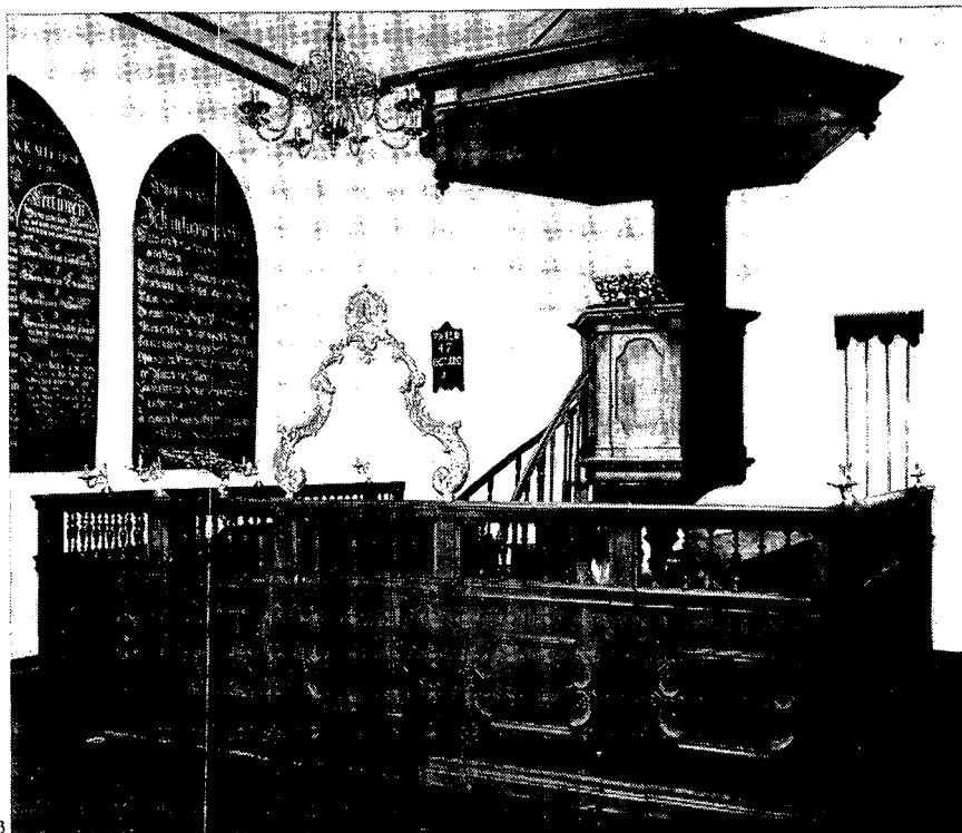
3 PREEKSTOEL MET DOOPHEK UIT WARDER, CA. 1750; EEN VAN DE PRONKSTUKKEN VAN HET MUSEUM