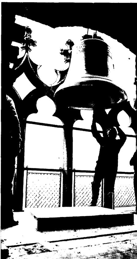
Eén der zeven nieuwe klokken voor het Utrecht's Domgelui wordt ingehaald in de toren.

proclameert in zijn opschrift: '... het zwerk, de verschrikkelijke en onheilspellende duisternissen en ook de ijzige winden breng ik in beweging ...'. De Maria (5822 kilo) verkondigt: '... ik ben een machtige vrouw ... de hinderlagen, de listige streken en de valsheid van de hoogmoedigen vertrap ik en verwoest het razende vuur van duivel en hel...'. Intussen: de late middeleeuwen zien vanuit een nauwelijks verleden tijd vol angst aanjagende demonische visioenen naar meer verlichte tijden en Johannes, ook nog een 'zware' (2360 kilo), is al wat vriendelijker: '... aangenaam kom ik met mijn stem van God ... door mijn geloof was ik een heilig licht, een sieraad in de woestijn ...'. En Magdalene (1360 kilo): '... ik ben de vrome zondares, vol lof ben ik ... over de voeten van mijn bruidegom stortte ik nardusbalsum en met mijn haren droogde ik die ...'. De nieuwe Van Wouklokken kregen de zinspreuken van hun voorgangers niet terug omdat ze niet meer te vinden zijn in de archieven. Zijn ze wat vrolijker geweest? In elk geval hun toonaard is dat wel.