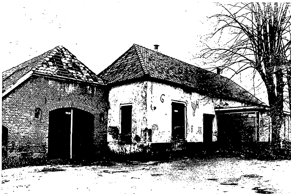
Booltink anno 1983: bijkans een ruïne. De aangebouwde schuur links kon, uit financiële overwegingen, in het restauratieplan niet gehandhaafd blijven.

ren hoofdgebouw zullen ook twee woningen komen. De gemeente Hengelo wil de omgeving 'passend' aankleden. Er moet een rijk in het groen gestoken dorpsbrink ontstaan,