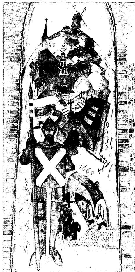
De historisch onbewezen ridder Berend van de Keyenburg. Muurschildering in de tegenover het Booltinkcomplex gelegen St. Janskerk. Jaartallen en gebouw-afbeeldingen corresponderen met de ingebruikname van de elkaar opvolgende kerken.