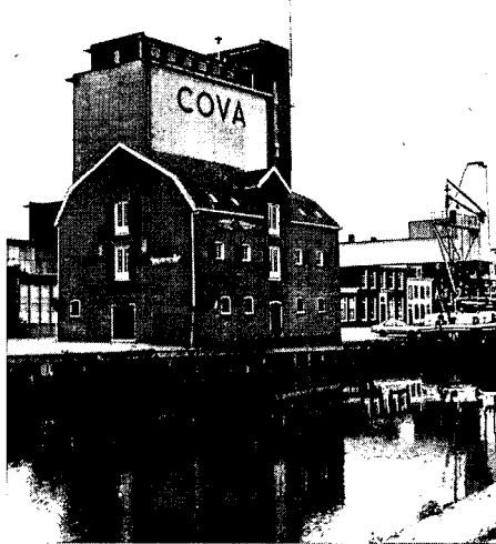
De voormalige gemeentelijke korenschuur 't Spijker met silo Cova en overslagbedrijf aan de Eem. Ook met sloop bedreigd.

drijvigheid die eigen is aan de haven- en kadefunctie dreigt hier ingeruild te worden ten behoeve van mooi wonen aan het water voor de happy few. Dit betekent bijvoorbeeld het verlies van onbeschermd industrieel erfgoed als het graanoverslag-