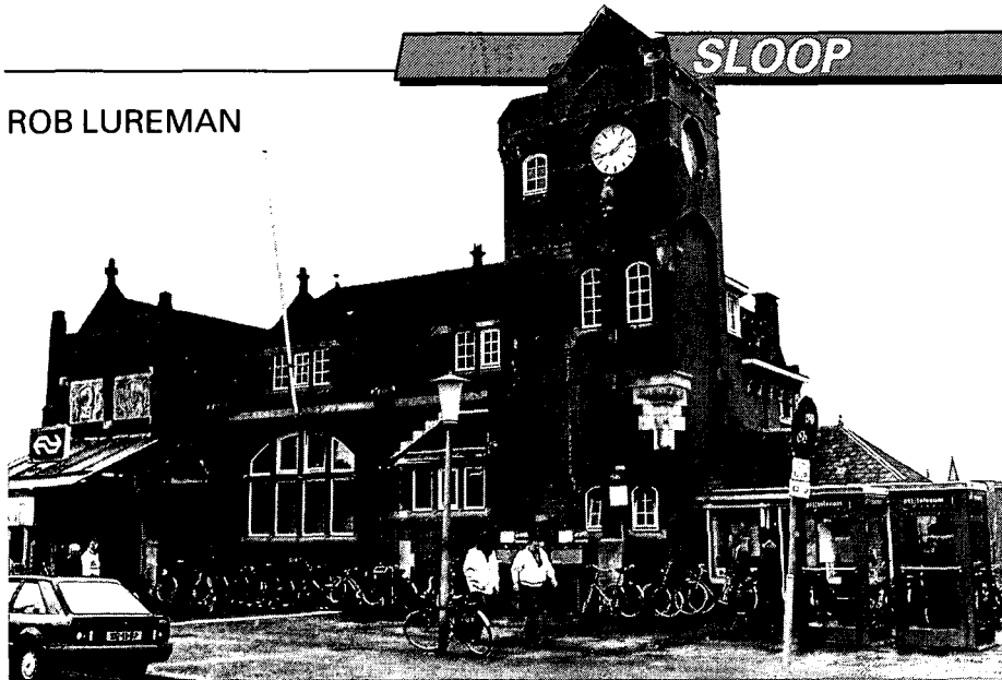
Het wegbestemde station van Margadant