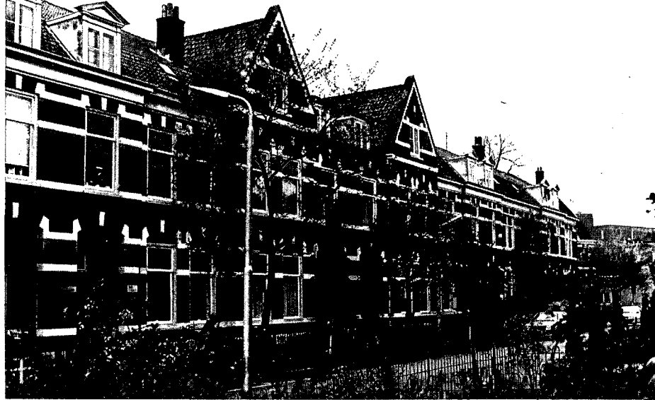
Nog gave gevelrij met portiekwoningen aan de Korte Bergstraat: wegbestemd.

dienen de metamorfose – kosten: 1,6 miljard gulden – reliëf te geven. Amersfoort wil niet achterblijven bij steden als Eindhoven, Nijmegen en Tilburg, waar soortgelijke operaties voor de deur staan. In het structuurplan van twee jaar geleden waren de Amersfoortse ambities van bescheiden omvang, maar de almaar roder kleurende cijfers van de verwachte exploitatietekorten bracht projectontwikkelaar OCA tot een nog weidse en grootschaliger invulling van de plannen met – logisch gevolg – nog meer werk voor de bulldozer. Ondanks deze schaalvergroting draagt het tekort op de grondexploitatie bij de eerste uitvoering van de plannen een slordige 21,7 miljoen gulden, waarbij onderweg nog de kosten van bodemsanering moeten worden opgeteld. De gemeente denkt aan al die uitgaven een mouw te passen via een beroep op de portemonnee van de rijksoverheid, maar of dit allemaal zo gemakkelijk zal gaan wordt politiek sterk betwijfeld.